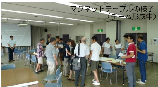
マグネットテーブルの様子 (チーム形成中)

※マグネットテーブルとは…お互いの問いに対する考えや想いを見せ合い、「似たことを書いている人」、「一緒になると化学反応を起こせそうな人」、「乗っかりたいと思える案を書いている人」が集まり(チーム)を形成して対話する手法