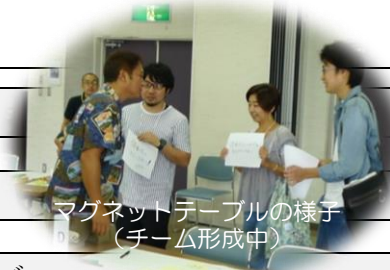
マグネットテーブルの様子 (チーム形成中)