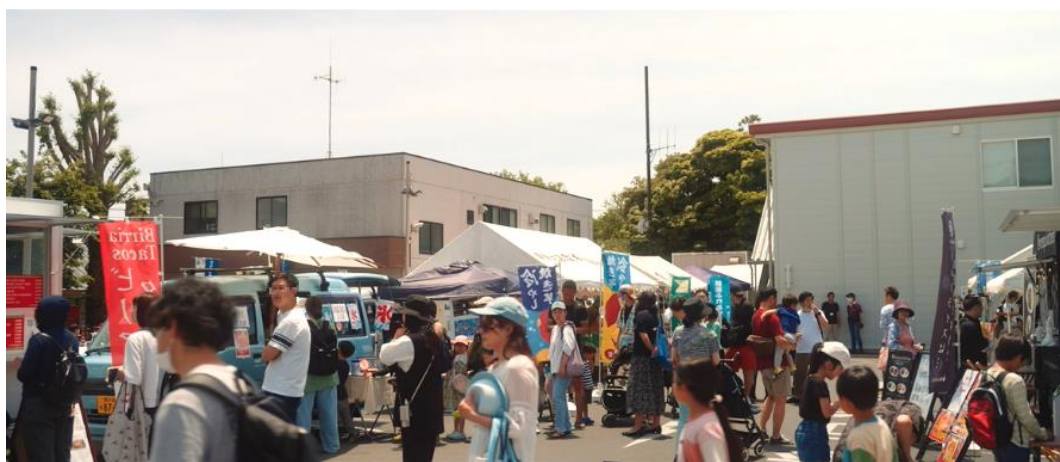
イベント当日は親子連れなど多くの来場者で賑いました