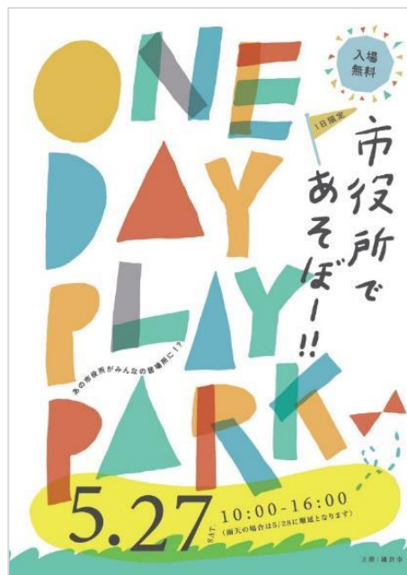
イベントフライヤー（表面・裏面）