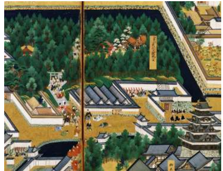
もみじやまぶんど

資料を整理して保管する建物 を意味する言葉で、その起源は古く、奈良時代にさかのぼります。鎌倉時代には、武家文化における幕府等の資料を保管したものや御家人などの屋敷にも「ふみくら」が設けられており、 書写などの活動も行われた場 であったそうです。