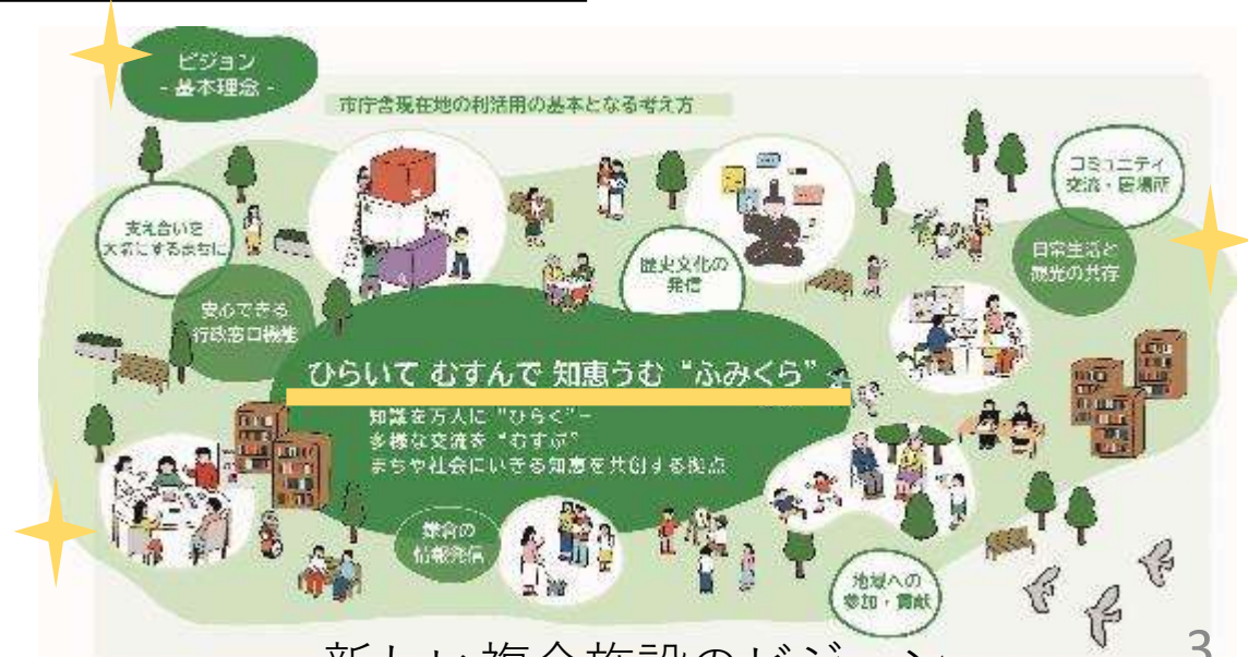
新しい複合施設のビジョン