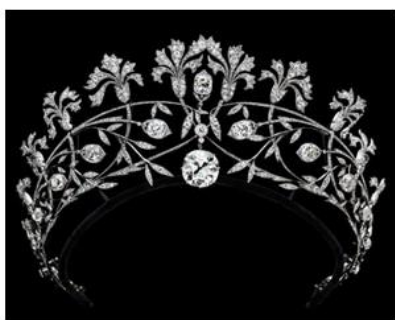
ショーメ作 ティアラ