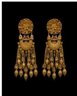
ヘレニズム 黄金のイヤリング