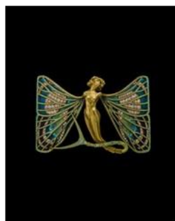
ルネ・ラリック作 バタフライブローチ