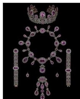
ピンクパールとダイヤモンド ジュエリーセット