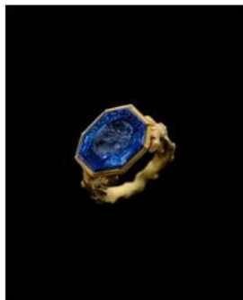
神聖ローマ帝国 フリードリヒ3世のリング