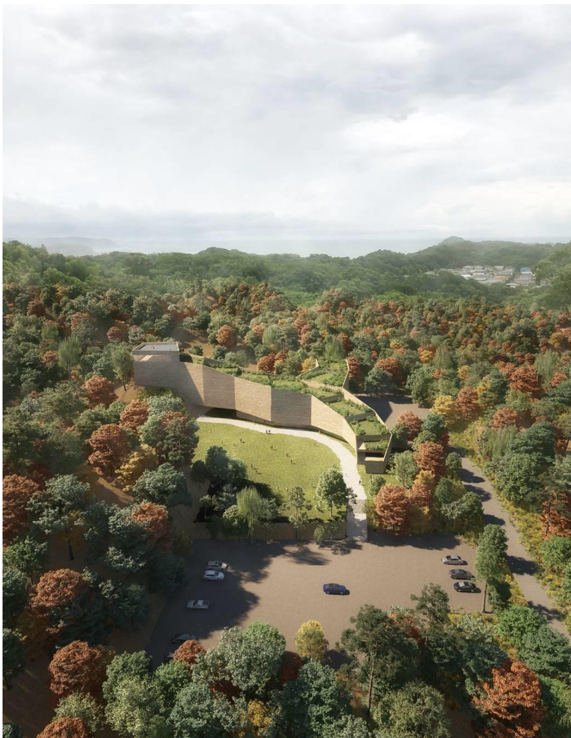
北側より全体鳥瞰（自然と一体になった地形のような建築）