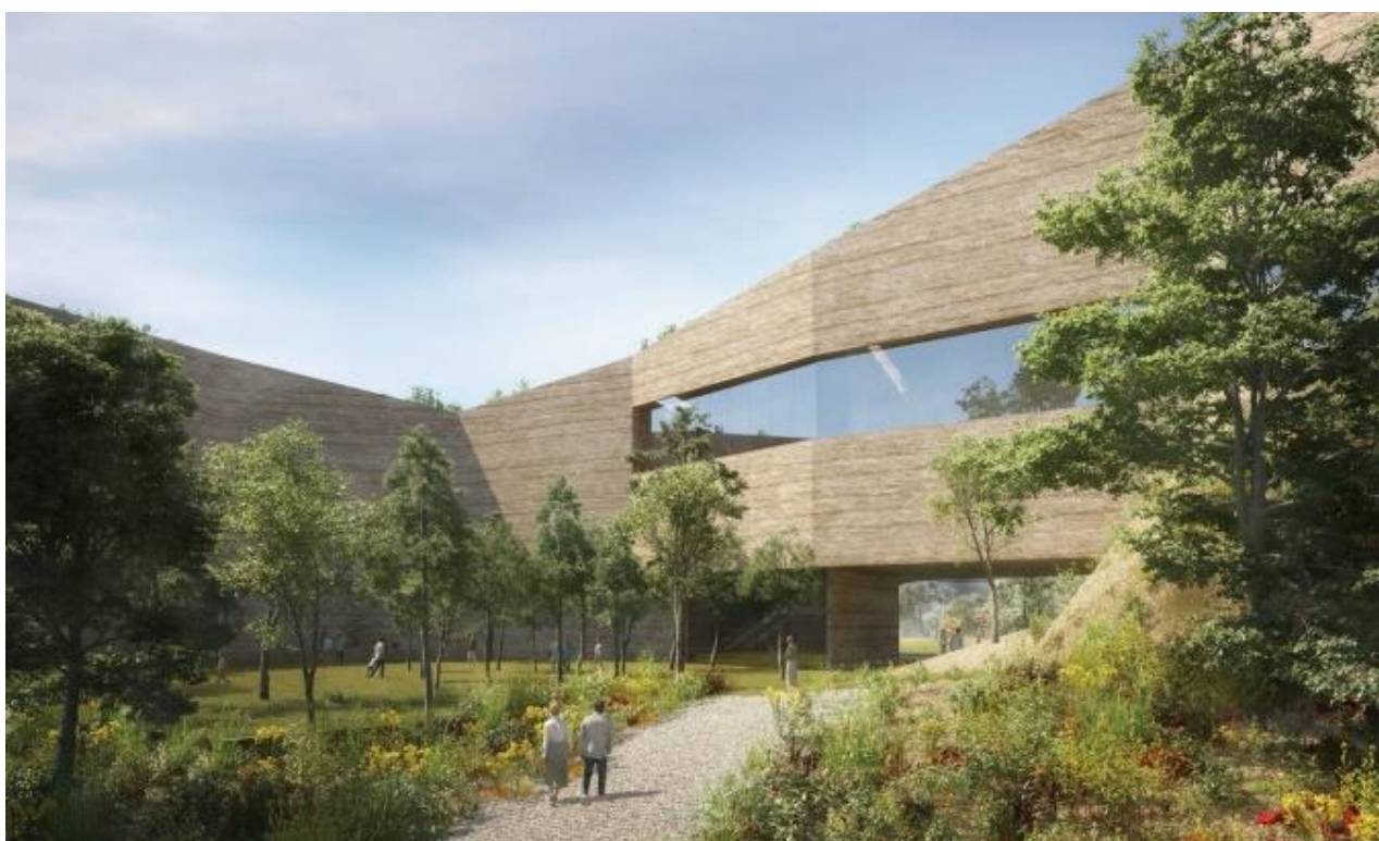
南側広場外観（「切通し」をイメージ）

※ 提案内容・画像は提案時のものであり、今後、変更となる可能性があります。また、画像は応募者が作成したものであり、著作権は応募者に帰属します。