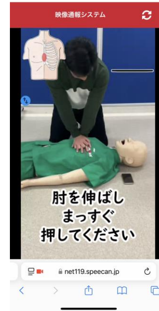
スマートフォンに送られた 応急処置の動画