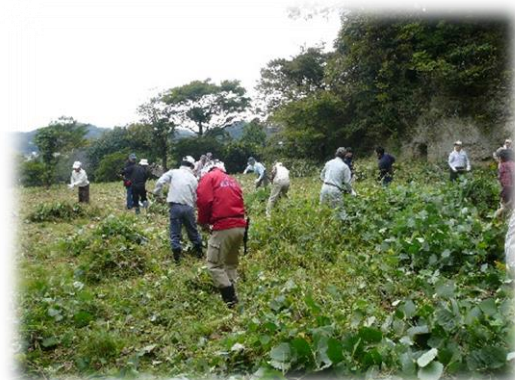
写真2-6 鎌倉風致保存会の活動