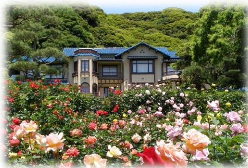
写真2-5 鎌倉文学館(旧前田家別邸)