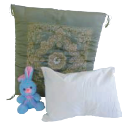
枕、クッション、座布団、ぬいぐるみ (有料袋(指定収集袋)に入るもの)