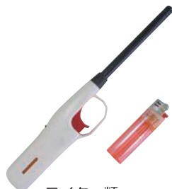
ライター類 (使い切ったもの)