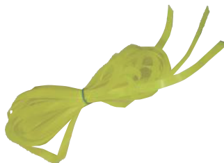
プラスチック製品 (容器包装プラスチック、製品プラスチックを除く)