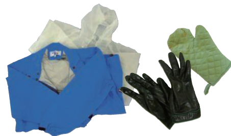
キルティング、レインコート、革手袋 (衣類以外の革製・羽毛入り・綿入り製品)