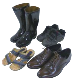
靴、長靴、スニーカー、スリッパ