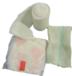
衛生用品 (包帯、生理用品)