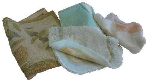
バスマット、トイレマット、カーペット類 (有料袋(指定収集袋)に入るもの)