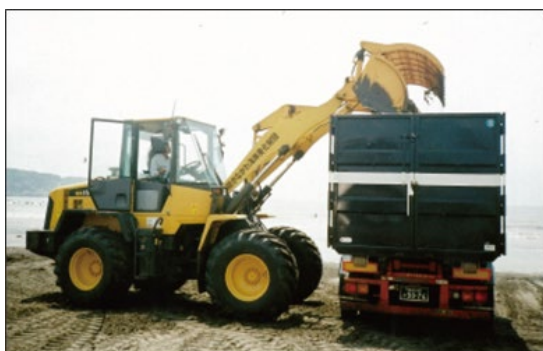
かながわ海岸美化財団 による清掃作業