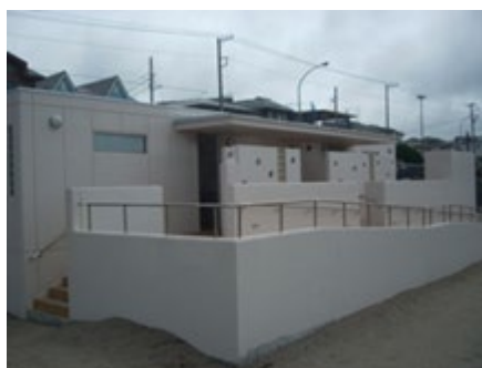
材木座海岸の公衆トイレ