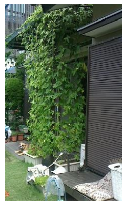
講座参加者のご自宅の緑のカーテン

令和元年(2019年)5月30日にゴーヤ栽培の専門知識を有する講師の方にゴーヤの栽培方法についてご講義いただきました。参加していただいた50名の方にゴーヤ苗を一人8株ずつ配布し、緑のカーテンの普及を図りました。令和元年に事業状況の見直しを行い、令和元年度をもって終了しました。