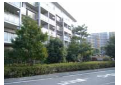
セットバック部分の緑化