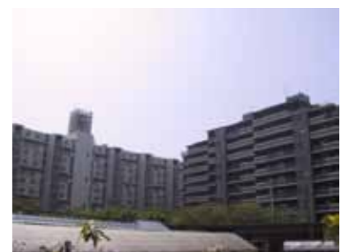
隣接する建築物との協調