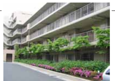
親しみを感じられる敷き際