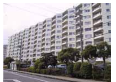
外壁の分節化による丁寧なデザイン