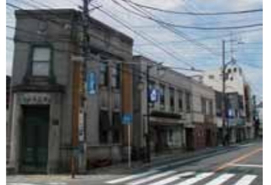
幹線を協調したまち並み