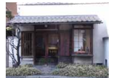
地域の伝統や歴史性を意識したデザイン