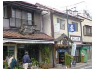
伝統的な素材の使用