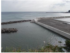
平成26年に完成した腰越漁港