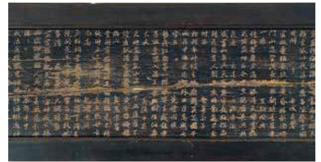
鎌倉市指定文化財「荏柄天神社詩板」 荏柄天神社蔵

て鎌倉五山の禅僧たちから寄せられた詩を板面に刻んだもので、禅僧の詩板が神社に伝来することは珍しく、大変貴重な資料です。 バラエティに富んだ鎌倉文化の粋をご堪能ください。 4月21日(土)~6月3日(日) … 午前9時~午後4時30分(入館は4時まで) 休館日…月曜日(4月30日は開館) 列品解説…土曜日。午後2時 観覧料…一般400円、小・中学生200円(団体割引あり)。市内の小・中学生と65歳以上の人は無料。福寿手帳などの提示を