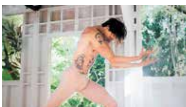
「ダンサー、セルゲイ・ポルーニン 世界一優雅な野獣」

開館…9:00~17:00(入館は16:30まで) 入館料…200円、小・中学生100円 映画鑑賞料金…1,000円、小・中学生500円(入館料含む) *映画チケットは4/21から販売。完売時点で販売終了…同館、島森書店、たらば書房、上州屋 休館日…月曜日(4/30は開館) ※上映後に「映画談話室」を実施。ゲスト:南美川洋子さん