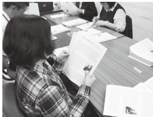
市役所内のワークステーション

障害者の雇用の促進と就労の場の確保、就労が困難な障害者等を支援、障害者雇用2,000人を目指し市役所内にワークステーションを開設