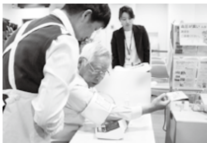
未病センターかまくら

アプリケーション・専用webサイトを活用した生活習慣の改善や健康づくりの推進、市内企業等を対象とした健康経営の推進