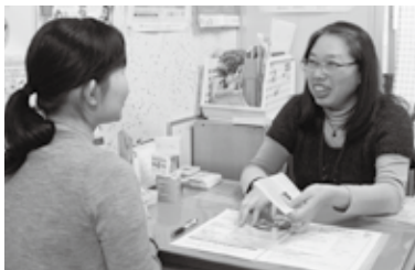
母子保健コーディネーターによる相談

母子保健コーディネーターを配置し産後ケア事業を開始、特定不妊・不育症治療費を助成