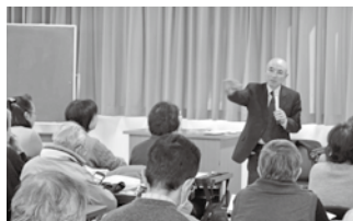
創立20周年記念公開講座風景