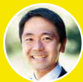
鎌倉市長 松尾 崇