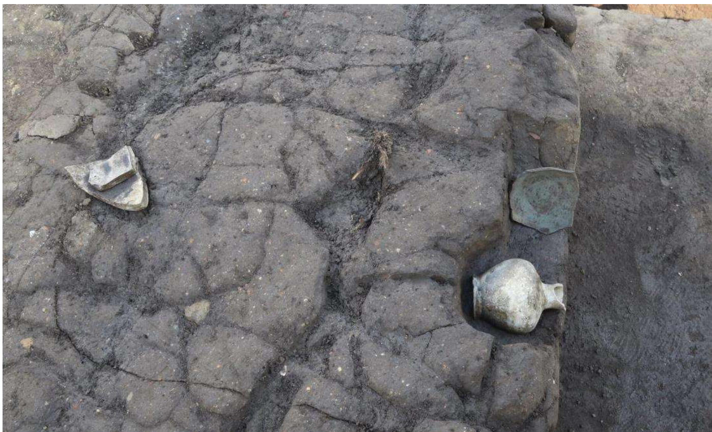
遺物出土状況（奈良時代から平安時代の壺や坏）