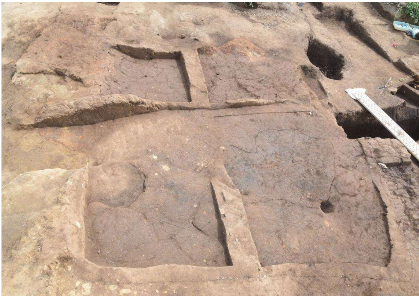
発見された奈良時代から平安時代の竪穴住居跡