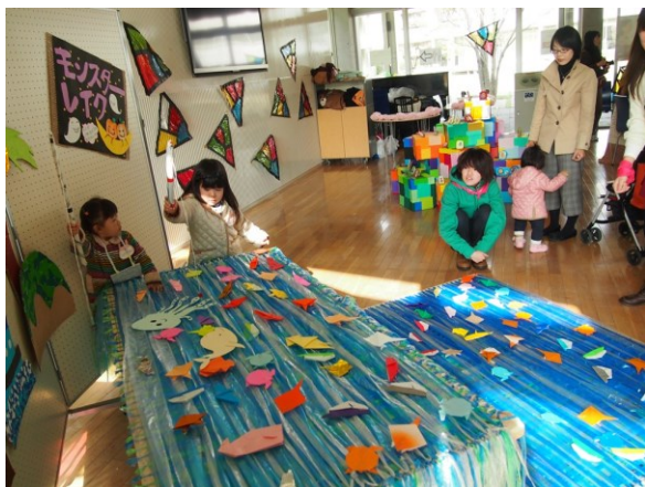
かまくらママ&パパ's カレッジ特別企画