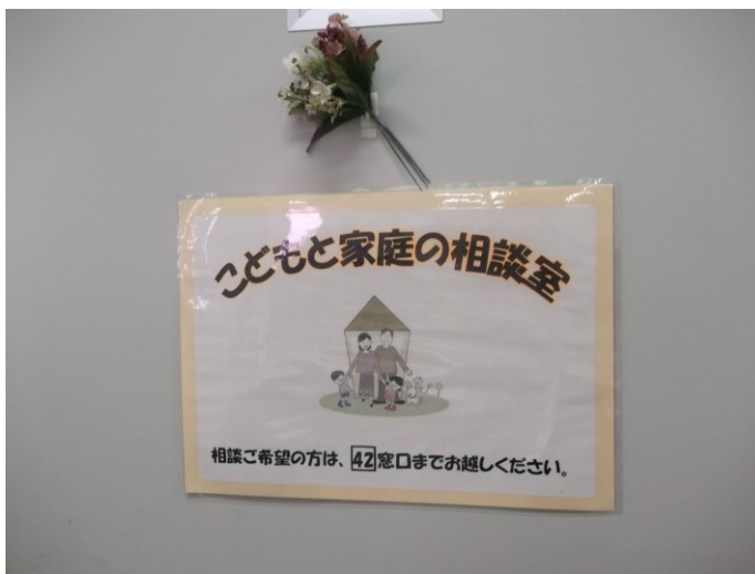
こどもと家庭の相談室