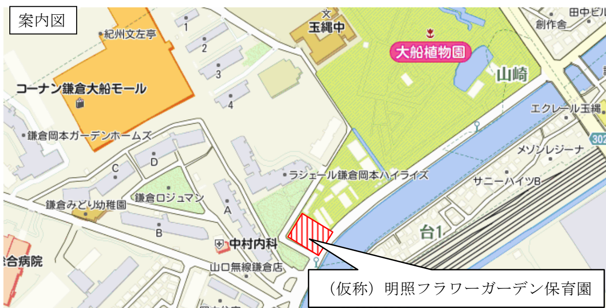
(参考) スケジュール (予定)

(仮称) 明照フラワーガーデン保育園は、平成 26 年 3 月に神奈川県から借用した県立フラワーセンター大船植物園苗ほ跡地にて、社会福祉法人つきかけ会が保育所を整備しています。現在建築工事を行っており、平成 27 年度中の開所を予定しております。定員は 90 人となっておりますが、開園に伴い当該法人が運営する岩瀬保育園植木分園を閉園する予定であり、植木分園の定員である 36 人を受け入れる形になるため、54 人の定員増となります。また、強い市民ニーズがある一時預かり事業を新たに実施する予定です。