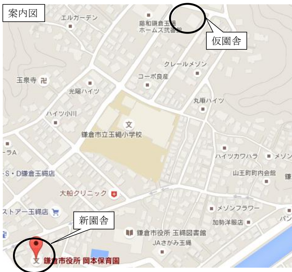
(参考) スケジュール (予定)

鎌倉市立岡本保育園は、平成 24 年度中に行った耐震診断の結果を受けて建替え工事を行っており、たまなわ児童遊園に設置した仮設園舎で運営を行っています。現在は園舎の内装工事を行っており、10 月 1 日に引渡しを受け、引っ越し後 10 月 13 日から保育を行う予定となっています。園舎の建替えに当たっては、定員を現在の 90 人から 10 人増やして 100 人とするほか、強い市民ニーズを受けて一時預かり事業を新たに実施する予定です。