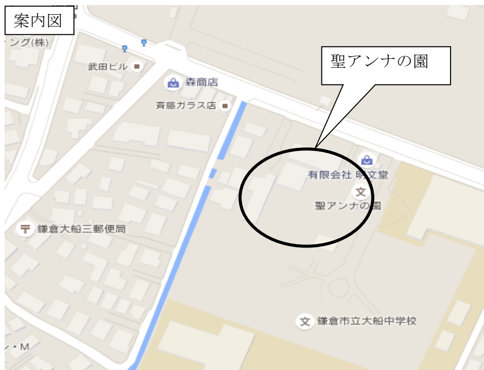
(参考) スケジュール (予定) H28

なお園舎の建替えに当たっては、定員を現在の140人から150人へ増員する予定となっています。