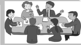
鎌倉市子ども・子育て会議等