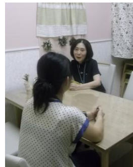
<子どもと家庭の相談室>

また、同じ子育ての悩みを抱えた保護者が集って話し合いを行う「ママのトークタイムわかば」を年間3クール実施しました。