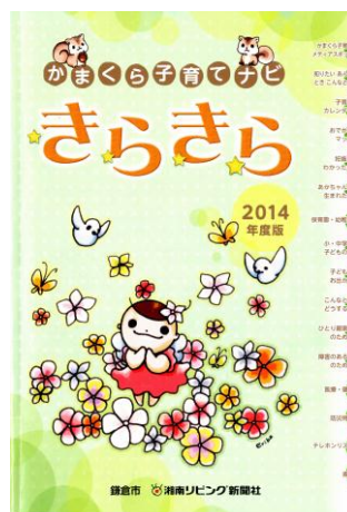
<かまくら子育てナビきらきら>

保育の安全確保及び市民ニーズの多様化に対応するため、保育施設の新築・改築等の整備を図りました。保育園みつばちの開設で、計60人の定員増となりました。