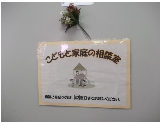
こどもと家庭の相談室