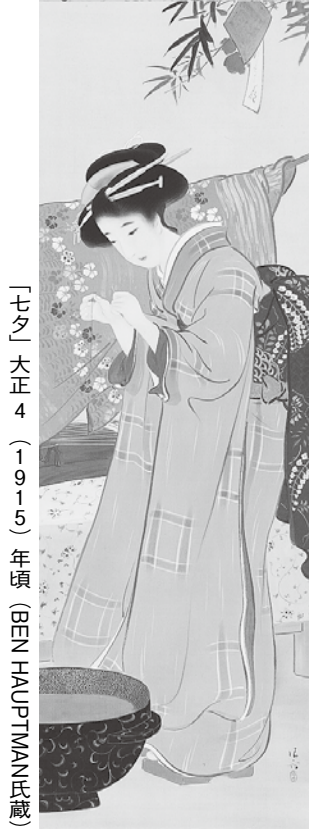
「七夕」大正4(1915)年頃(BEN HAUPTMANN氏蔵)

市民講座 4/23・24・25・26=13:30から 4/27=11:00から 各1時間 清方の芸術と日本画、美術館について、同館スタッフがお話しします(予約不要。要入館料)。