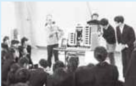
1分間で660票の投票用紙を分類する機械を実際に使用

中学生が自ら考え投票することの重要性を学ぶ場として、明るい選挙推進協議会と選挙管理委員会では、出前授業「模擬選挙」を実施しています。