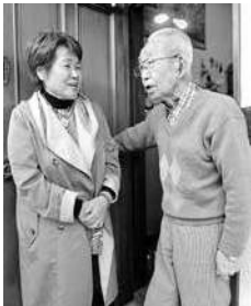
散歩を兼ねて地域の高齢者を訪ねる民生委員(左)

囲当日参加もできますが、なるべく事前に議会事務局(内線2446、FAX23-5825、gikai02@city.kamakura.kanagawa.jp)へお申し込みください。19日は保育ボランティアがおりますので、託児を希望する人は9日までにご連絡ください