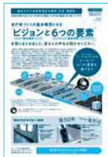
「公共施設再編計画 NEWS No.25」