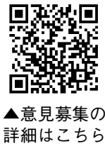
▲意見募集の 詳細はこちら

基本的な考え方(理念や規模など)を検討し、基本構想の策定作業を進めてきました。このたび取りまとめた、基本理念(ビジョン)、「市民のニーズや社会情勢の変化に対応するコンパクトな本庁舎」と基本方針(6つの要素)を柱とした基本構想(素案)について、ぜひ、同NEWSもご覧の上、5月20日(月)までにご意見をお寄せください。