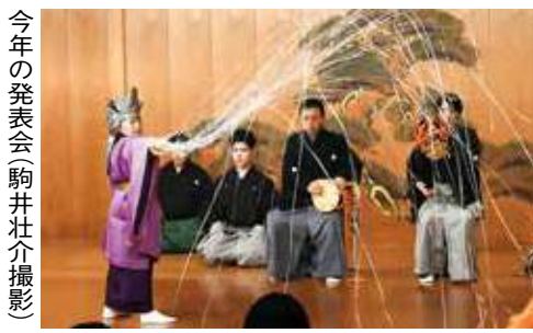
今年の発表会

ユネスコの世界無形文化遺産に登録されている日本の伝統芸能である能楽を、本物の装束や舞台を使って稽古します。指導は中森貫太さん(観)