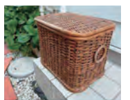
本市でモデル事業を行ったときの排出例