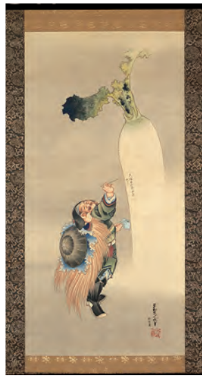
葛飾北斎筆「大黒に大根図」(氏家浮世絵コレクション蔵)

本コレクションは、故・氏家武雄氏が長年にわたって収集した肉筆の浮世絵を保管・展示するため、鎌倉国宝館内に置かれています。本展では、葛飾北斎の作品を中心に、菱川師宣、宮川長春、勝川春章らの肉筆浮世絵を一堂に展覧し、浮世絵の草創期から幕末に至るまでの作品を紹介し、絵師の筆遣いが直に感じられる肉筆浮世絵の華麗なる美しさを堪能ください。展示解説は、同館ホームページを。