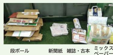
段ボール 新聞紙 雑誌・古本 ミックスペーパー