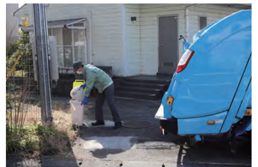
戸別収集のイメージ

現在、クリーンステーション収集を取り巻く環境の変化を踏まえ、持続可能な収集方法の一つとして導入に向けた検討を進めています。