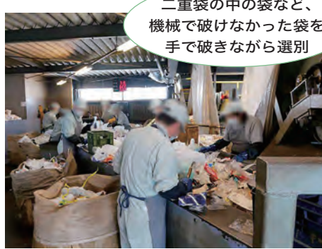
二重袋の中の袋など、機械で破けなかった袋を手で破きながら選別