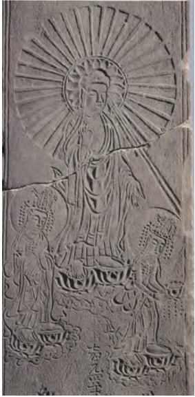
阿弥陀三尊来迎図 板碑 (海蔵寺蔵) 市指定文化財

市内の発掘調査では、屋敷跡や庶民が住んだ地域からも仏像・仏具・供養塔など仏教信仰に関わる様々なものが見つかっています。このことから、庶民の日常生活にも仏教信仰が広まっており、仏への祈りは身近なものであったといえるでしょう。本展では、出土した