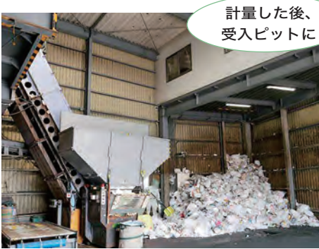
計量した後、受入ピットに