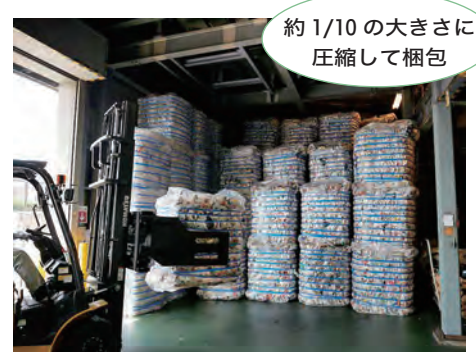
約1/10の大きさに圧縮して梱包

袋の中身を一つ一つ、手作業で選別します。資源化できない異物はここで取り除きます。