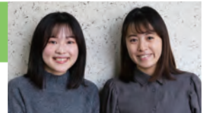
ごみ減量対策課の職員

下記を参考に、ごみの散乱や収集されずに残ってしまうことのないよう、ご協力をお願いします。