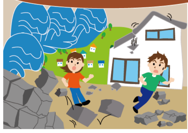
津波からの迅速な避難を妨げます