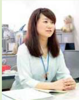
窓口で保護者に保育園の入所案内をする職員

「子育てに関するいろいろな業務です。公立保育園の運営や入所に関すること、待機児童問題にも取り組んでいます。用件があつて担当の保育園に行く、園児たちに癒やされます」