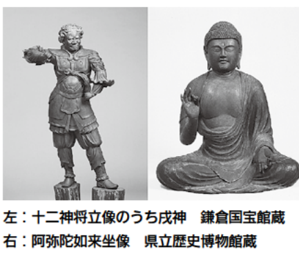
左：十二神将立像のうち戌神 鎌倉国宝館蔵 右：阿弥陀如来坐像 県立歴史博物館蔵

【申し込み】 5月17日(必着)までに往復はがき(1人1枚)で、催し名住所・氏名・電話番号を、同館(〒248-0005雪下2-1の1)へ。