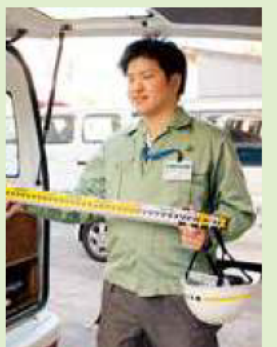
機材を車に積み現場へ

年3月卒業見込みを含む)か、同程度の学力のある人 ▼電気事業法の規定に基づく主任技術者の資格を持つ、学校教育法による大学を卒業した人(30年3月卒業見込みを含む)か、同程度の学力のある人 ⑤Ⅱ学校教育法による大学の化学に関する学部学科を卒業した人(30年3月に卒業見込みを含む)か、同程度の学力のある人 ⑥Ⅱ次のいずれにも該当する人。▼受験しようとする職種(事務・建築・土木・電気・化学)の学歴・資格要件に当てはまる人 ▼障害者手帳の交付を受け、介助者なしで職務の遂行が可能な人 申し込み 特定記録郵便で5月19日(消印有効)までに必要書類を職員課(〒248-8686 住所の記載不要 鎌倉市役所)へ提出してください。 詳細は受験案内をご覧ください。市役所・支所・市ホームページで配布します。