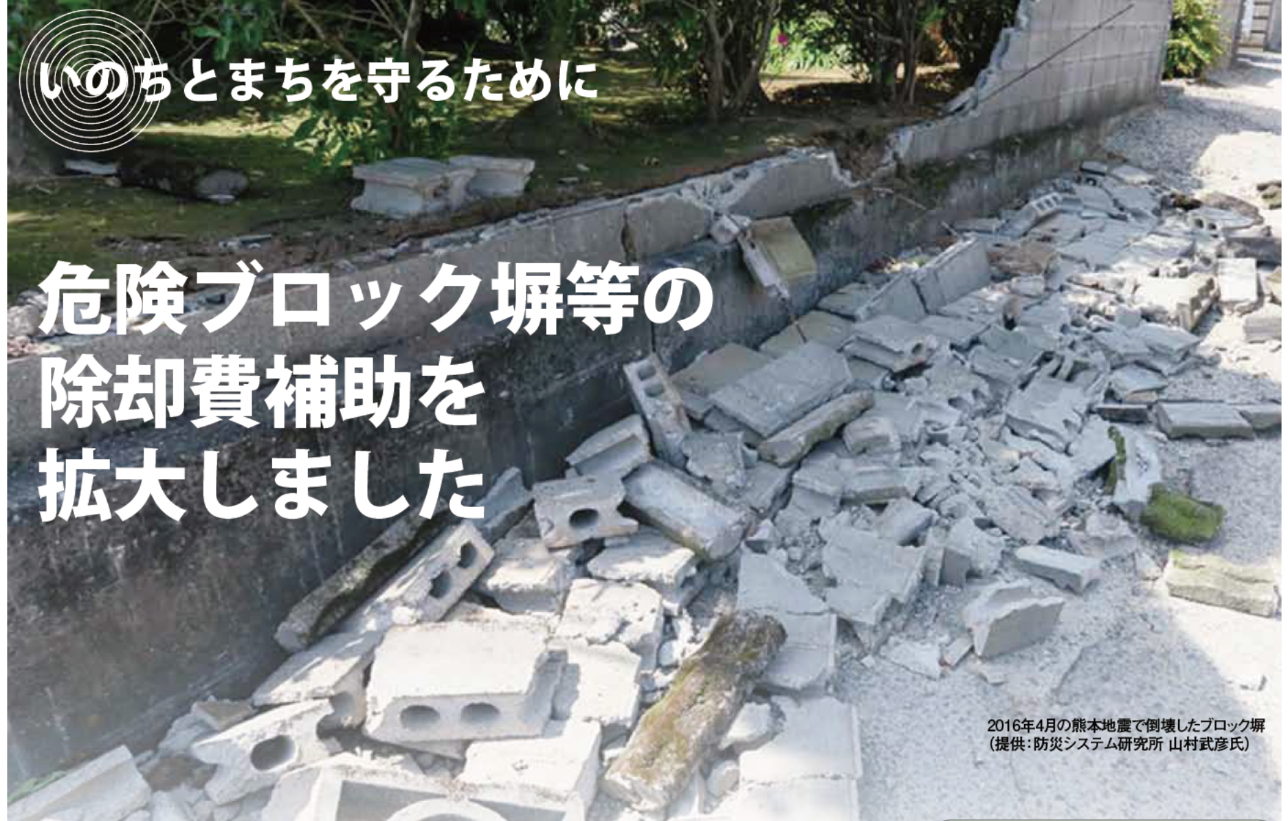
2016年4月の熊本地震で倒壊したブロック塀

強度不足や老朽化が著しいブロック塀等は大規模な地震の際に倒壊しやすく、多くの二次災害をもたらします。市は市民の安全を守るため、通学路に面し、倒壊の恐れのある危険ブロック塀等の除却費を補助してきました。