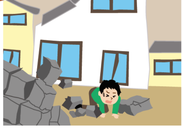
倒壊によりけがをする危険があります