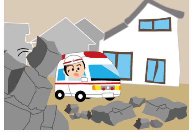
緊急車両の通行の妨げになります