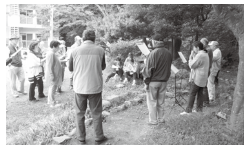
ハーモニカ伴奏による合唱

鎌倉市を中心に湘南地区などに住むシルバークロスアップの会「湘南鎌倉生涯現役の会湘現会」を紹介します。湘現会は、人生百年時代を迎えようとする現代社会において、「元気でいたい」「社会のために役立つこと」「生きたい」「生きがいのある生活を送りたい」という私たちの願いを、仲間と共