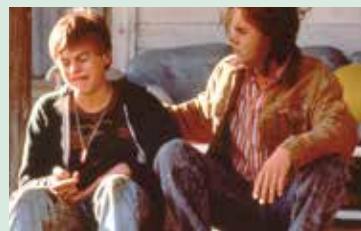
©1993・DORSET SQUARE FILM PRODUCTION AND DISTRIBUTION KFT. 「ギルバート・グレイブ」

開館：9:00~17:00(入館は16:30まで) 入館料：一般200円、小・中学生100円 休館日：月曜日(9/17は開館)