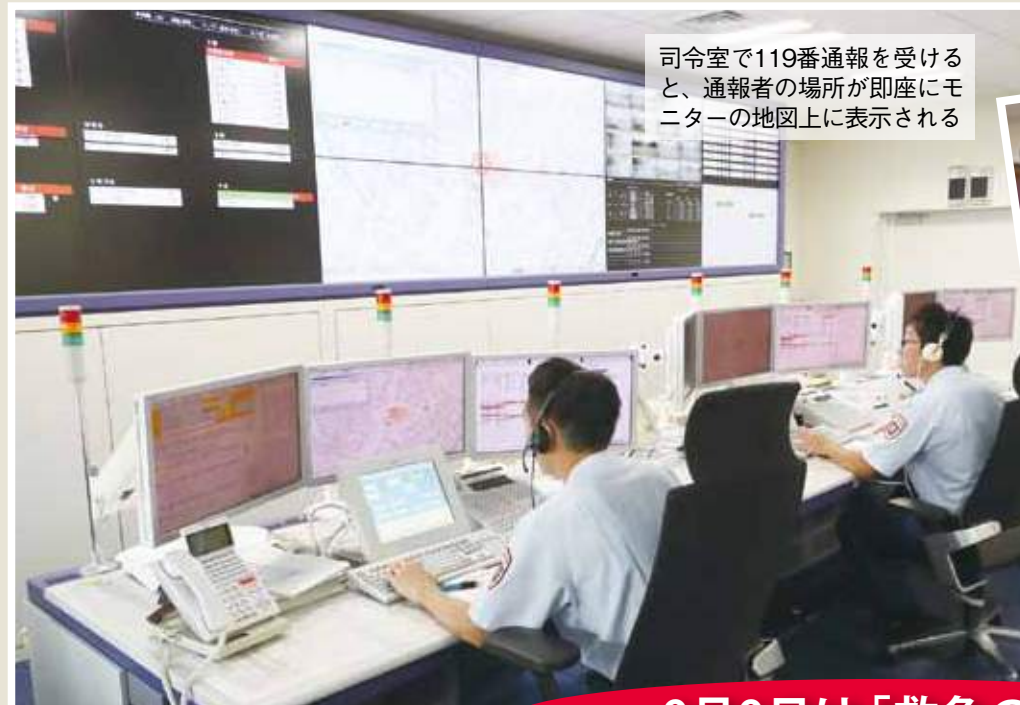
司令室で119番通報を受けると、通報者の場所が即座にモニターの地図上に表示される