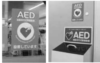
AED設置を知らせるステッカー(左)、店内の様子(右)

6/30 現在で市内コンビニエンスストア51店舗へのAEDの設置が完了しました。設置済みの店舗のドア付近にはステッカー(写真)を貼付しています。今後も市民がいつでもAEDを使える環境を整えます。市ホームページで市内AEDマップもご覧になれます。