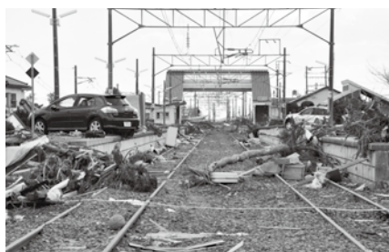
被災から約10日後の山下駅(山元町)

全国から届いた膨大な量の支援物資は、町役場に面した国道から駐車場に運び込まれました。町役場の駐車場などを集積拠点にして、仕分けや避難所などへの輸送が効率的に進められていました。また保健センターが隣接していたので、町役場と円滑に情報が共有でき、保健師によるケアがきめ細やかに行われていました。町役場が津波被害から免れて機能したことに加え、道路環境の良さ、敷地の広さ、関係機関の集中といった立地は、住民支援を全力で取り組むには必要不可欠だと強く感じました。