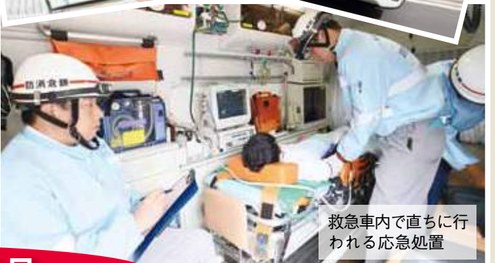
救急車内で直ちに行われる応急処置