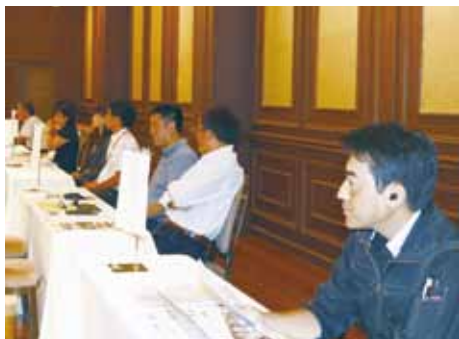
採用担当者が待ち受けるブース

「セカンドライフかまくら」主催の合同就職説明会(7/27・写真上下)。市民39人と事業者10社が参加し、事業者のプレゼンテーションの後、興味を持った人と各ブースの採用担当者が面談を行いました。次回は10/25開催(詳細は2面)。