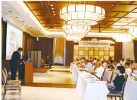
事業者が熱心に仕事の説明をしました

「セカンドライフかまくら」主催の合同就職説明会(7/27・写真上下)。市民39人と事業者10社が参加し、事業者のプレゼンテーションの後、興味を持った人と各ブースの採用担当者が面談を行いました。次回は10/25開催(詳細は2面)。