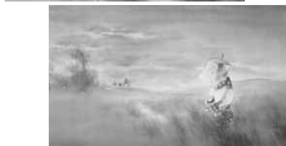
《日野阿新(上) 橋逸勢女(下)》 明治35(1902)年 鏑木清方記念美術館蔵