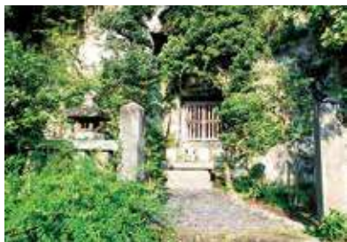
相馬師常墓やぐら

89)年の奥州合戦にも従軍して戦功を重ねた、幕府草創期の有力御家人の一人でした。仏教をあつく信仰したことでも知られ、『吾妻鏡』元久二(1205)年十一月十五日条には、信心深かった師常が念仏を唱