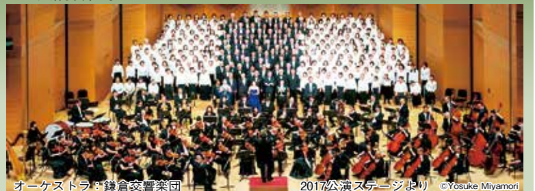
オーケストラ:鎌倉交響楽団