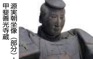
源実朝坐像(部分)・甲斐善光寺蔵