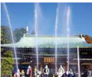
消防総合訓練 (龍寶寺・昨年)

【中止の場合】 いずれも消防テレホンサービス(☎0120-24-0467)でお知らせします。出初式は市ホームページでも。