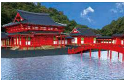
永福寺復元CG (湘南工科大学制作)