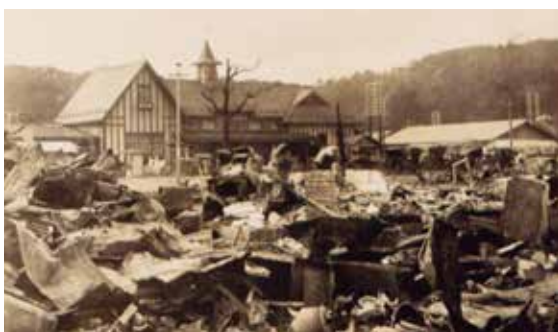
鎌倉駅前の火災跡 (大正関東地震・大正12年)

とき…1月4日(金)~5月18日(土) 午前10時~午後4時(入館は3時30分まで)。日曜・祝日休館 観覧料…一般300円、小・中学生100円