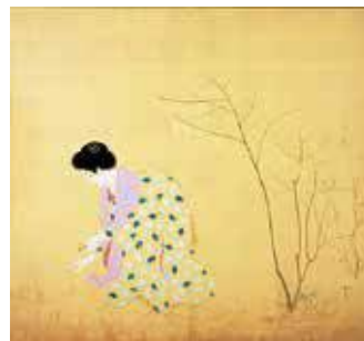
「早春」 大正7(1918)年 同館蔵

美人画は世界に類を見ない日本特有の絵画で、鍋木清方は江戸そして東京の女性美に憧れの心を投影し、江戸の香り高い粋と品格、季節の風情に満ちあふれた数々の名作を生み出しました。本企画展では、清方が尊敬する梶田半古の影響が色濃くみられる「浅みどり」をはじめ、「早春」や「金色夜叉の絵看板」など、市井の女性や文学作品に登場する女性を描いた作品を紹介します。