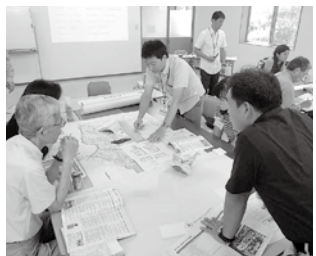
平成28年度市民対話(ワークショップ)の様子

多面からご意見をいただきながら、28年度に「現在地で建て替え」「現庁舎の長寿命化」「移転」の選択肢から「移転」の方針を決定しました。その上で、29年度には移転先を市所有の「野村総合研究所跡地」と「深沢地域整備事業用地」の選択肢から全体的な視点で「深沢地域整備事業用地」として選んでいます。