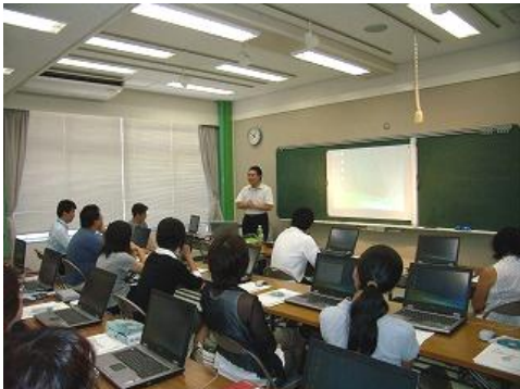
教員の指導力向上の研修

「学校課題解決研修会」では、校内研修を支援するため、学校からの要請にもとづいて講師を派遣し、研修の充実を図っています。