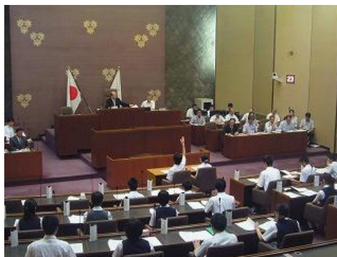
子ども議会（中学生）

平成13年度から、議会制民主主義への理解を深めながら地方自治の仕組みについて体験を通して学習する目的で開催しています。隔年で小学校と中学校が交互に対象となり、各学校2名の代表が参加して一般質問、子ども議会宣言の採択を行っています。