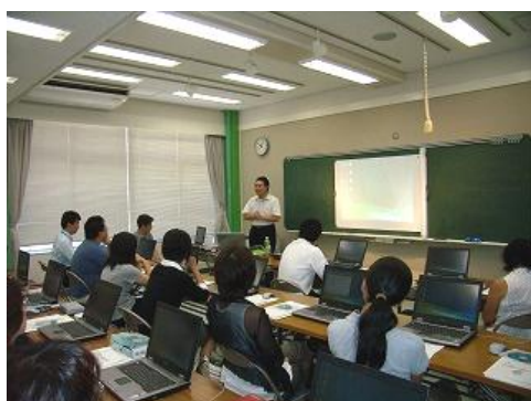
教員の指導力向上の研修

「学校課題研修会」では、校内研修を支援するため、学校からの要請にもとづいて講師を派遣し、研修の充実を図っています。