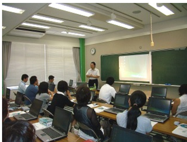
教員の指導力向上の研修

日本語の理解や学校生活に十分に適応できていない帰国児童生徒、外国につながるの児童生徒などに対し、日本語指導等の支援を行い、学校生活への適応を図っています。