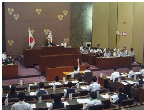
子ども議会(中学生)

平成13年度から、議会制民主主義への理解を深めながら地方自治の仕組みについて体験を通して学習する目的で開催しています。隔年で小学校と中学校が交互に対象となり、各学校2名の代表が参加して一般質問、子ども議会宣言の採択を行っています。