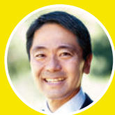
鎌倉市長 松尾 崇