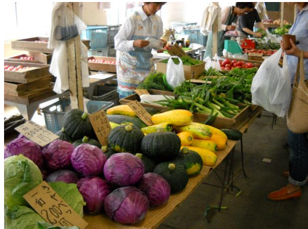
鎌倉市農協連即売所での直売の様子

また、平成 23 年 3 月には、「鎌倉やさい」の更なる販売促進に向けて、「鎌倉ブランドマーク」の商標登録が行われている。