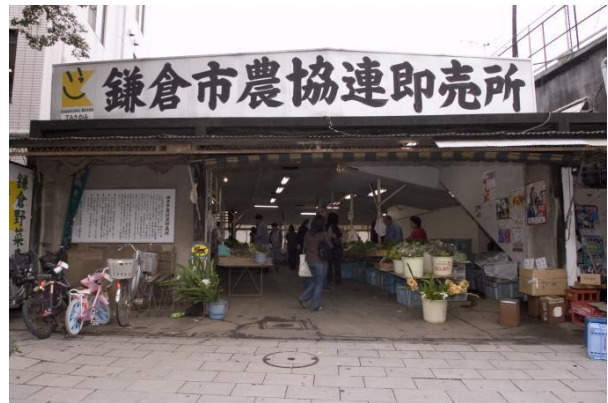
鎌倉市農協連即売所（鎌倉市小町）

その他、秋の収穫まつり、鎌倉・腰越漁業協同組合の朝市、各種イベントでの販売や、小学校・保育園の給食食材としても使用されている。