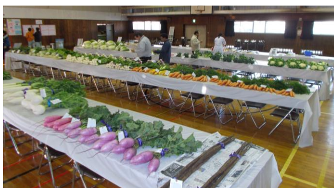
秋の収穫まつりで野菜の展示・販売

市内の主要作物としては、ダイコン(351 t)、トマト(262 t)、キュウリ(167 t)、ジャガイモ(160 t)、キャベツ(144 t)、ホウレンソウ(125 t)、ネギ(122 t)。