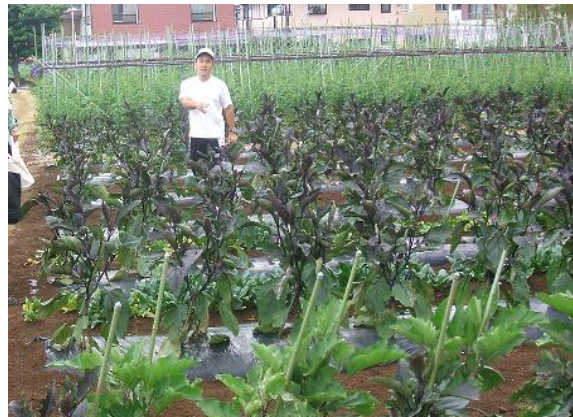
手広地区内生産緑地の七色畑