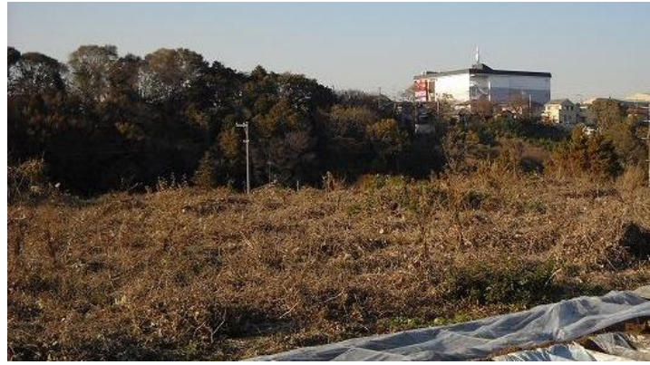
関谷地区の遊休農地

た結果、関谷・城廻地区の農業振興地域内の農用地区域内の遊休農地面積(表2)は、平成20年度から平成22年度にかけて毎年、少しずつ解消されたが、平成23年度の遊休農地は、約3.4haで前年と比較し、微増している。