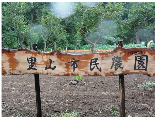
今泉台に開設された里山市民農園

平成 22 年度第 1 回農地相談会では「生産緑地の活用」についての相談があり、土地所有者による市民農園の新規開設が提案された。市はその開設準備を支援し、平成 23 年度には大船地域に新たな市民農園 1 園が開設された。