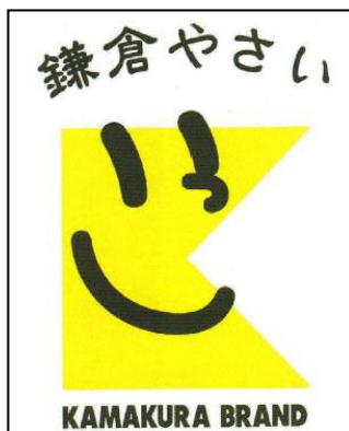
鎌倉ブランドマーク

平成5年から、さがみ農業協同組合（以下「JAさがみ」という。）、農業者及び市が連携し、農産物のブランド化の検討が開始され、平成6年に鎌倉ブランドマークを発表、平成10年7月には鎌倉ブランド会議を発足し、鎌倉ブランドの推進活動を行っている。