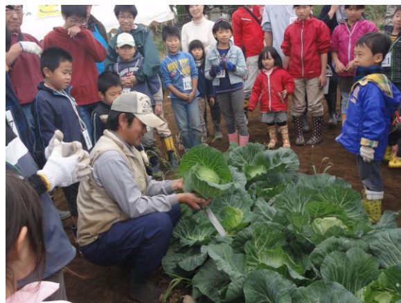
JA さがみ鎌倉市青壮年部親子農業体験 2012

平成 23 年度には大船地域に新たな市民農園 1 園が開設されたことを紹介したが、今後も、農地所有者の意向を確認しながら、市民が農業とふれあえる新たな市民農園の開設についても支援していくことが必要である。