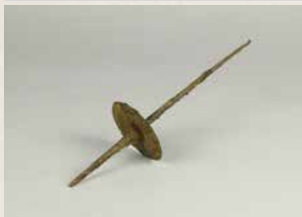
若宮大路周辺遺跡群② 出土の紡垂車