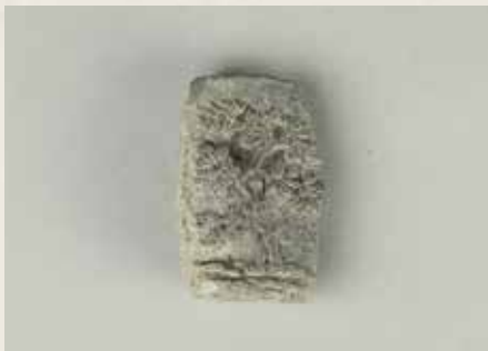
若宮大路周辺遺跡群③ 出土の滑石スタンプ