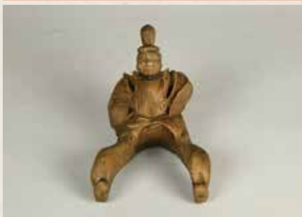
若宮大路周辺遺跡群② 出土の人形