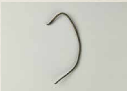
若宮大路周辺遺跡群② 出土の耳掻き