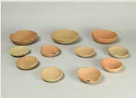
若宮大路周辺遺跡群③ 出土のかわらけ