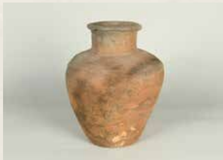
若宮大路周辺遺跡群② 出土の常滑壺