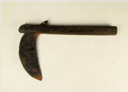
若宮大路周辺遺跡群② 出土の鎌