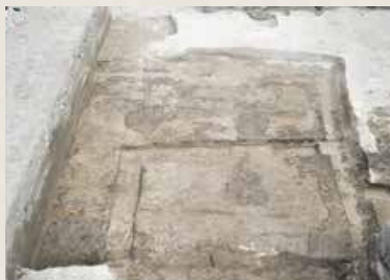
若宮大路周辺遺跡群① 出土の竪穴建物

今回の速報展では、令和4年度(2022年度)に市内で行われた発掘調査の中から、大倉幕府周辺遺跡群(雪ノ下三丁目660番3ほか9筆地点)、若宮大路周辺遺跡群①(御成町763番4の一部地点)、若宮大路周辺遺跡群②(雪ノ下一丁目120番の一部地点)、若宮大路周辺遺跡群③(雪ノ下一丁目209番4地点)などの調査結果を、実際に出土した資料や調査写真等とともにご紹介します。