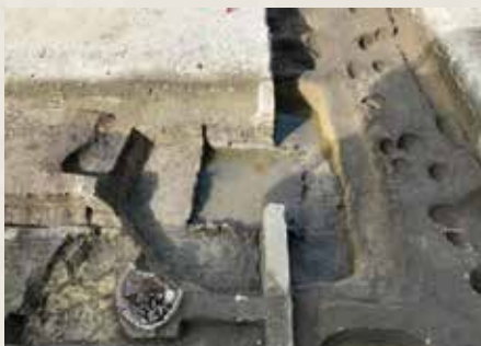
若宮大路周辺遺跡群① 出土の井戸