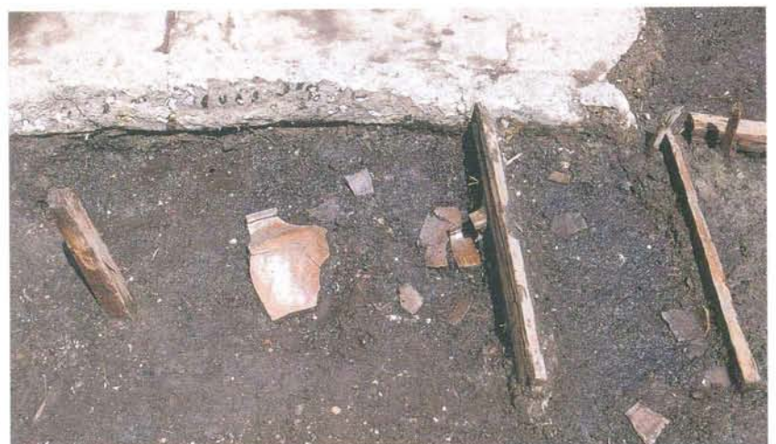
木組みの溝跡 (南側調査区第4面)