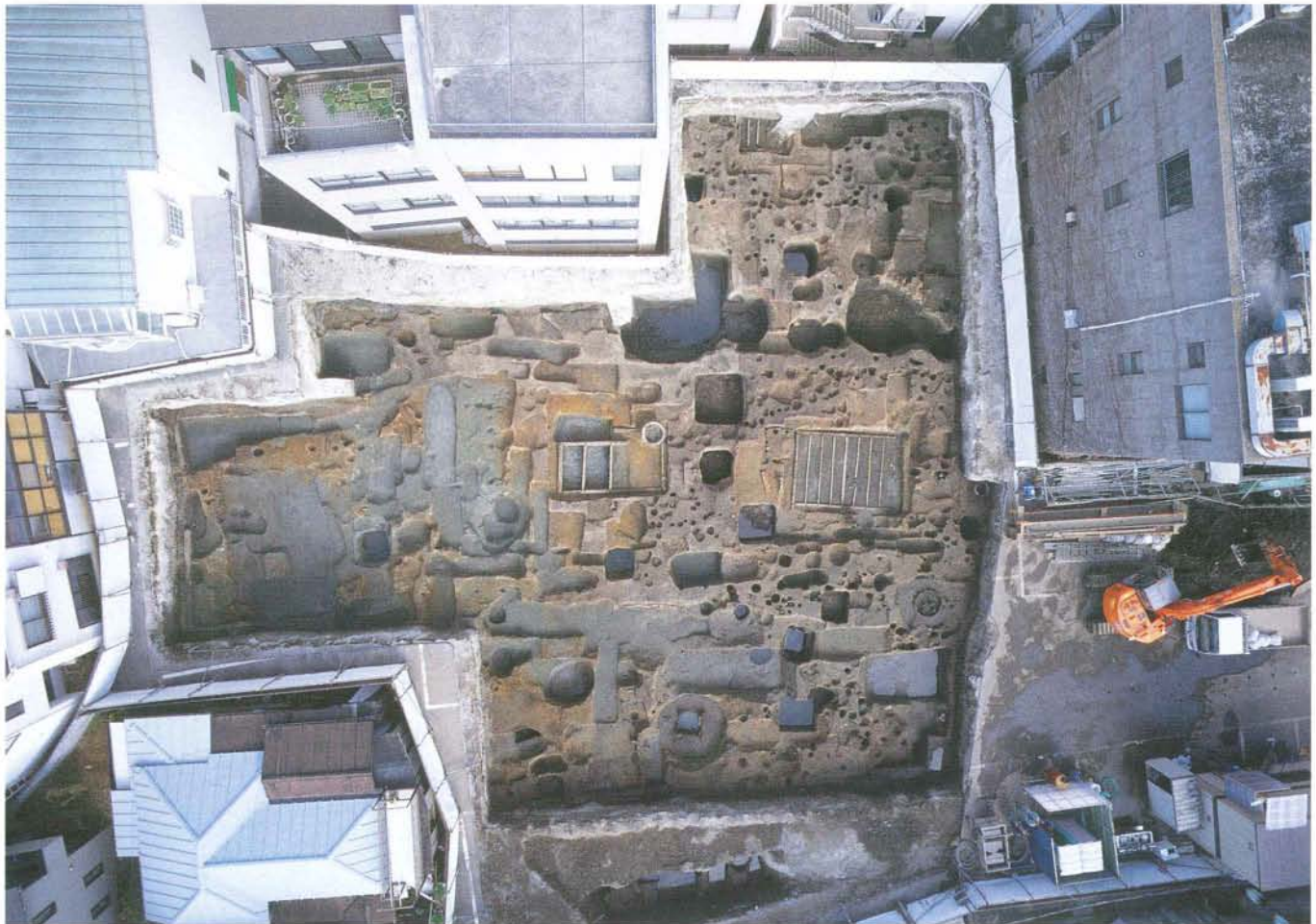
若宮大路周辺遺跡群発掘調査区全景

出土品からすると古代の遺構群は古墳時代から奈良・平安時代、中世のものは13世紀前半から14世紀後半にかけてくり返しつくられたと推定されます。ここから80m程離れた いまこうじにしいせき 今小路西遺跡（現、御成小学校）では奈良時代の役所の跡と、中世の武家屋敷を中心としたまちの跡が見つかったので、この場所も古代から中世にかけて栄えたことが想像できます。