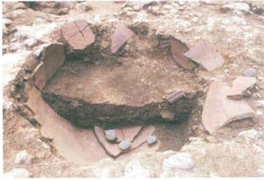
常滑甕出土状態（納骨堂中央）