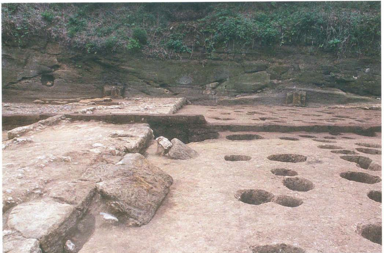
石列と柱穴群（調査区中央付近）