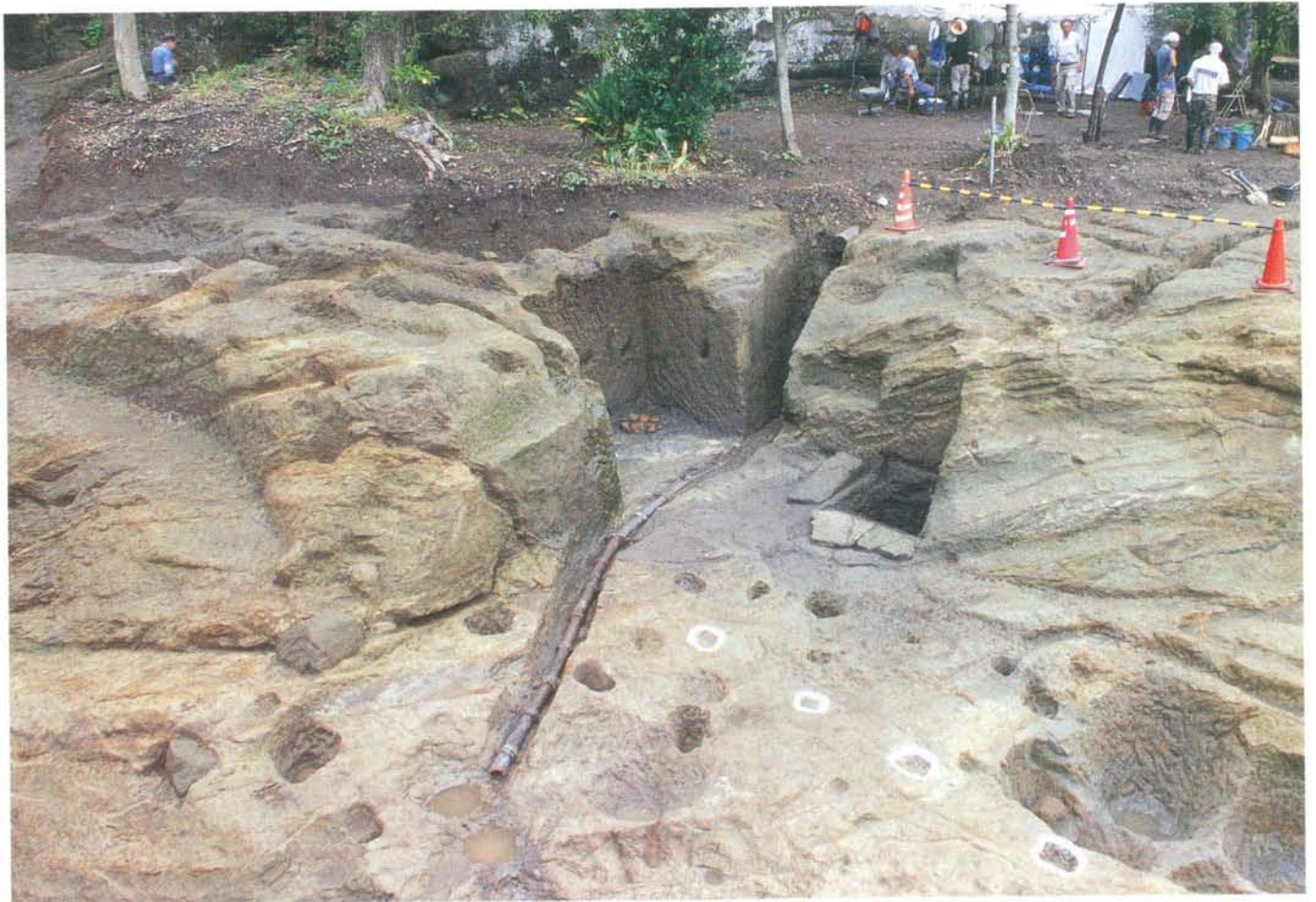
やぐらと掘立柱建物跡(南側調査区)