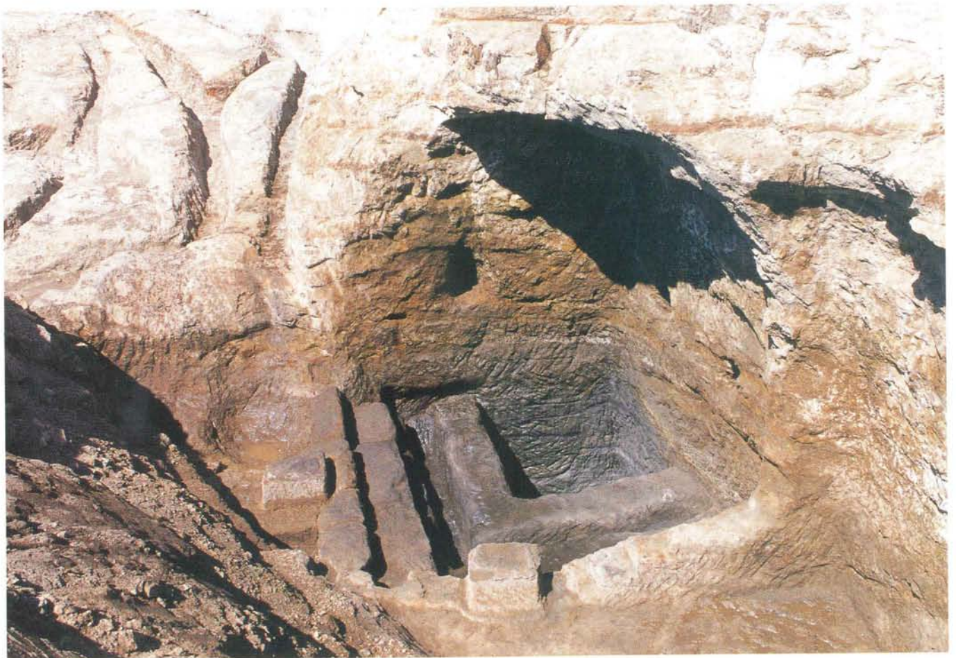
やぐら(南側調査区)