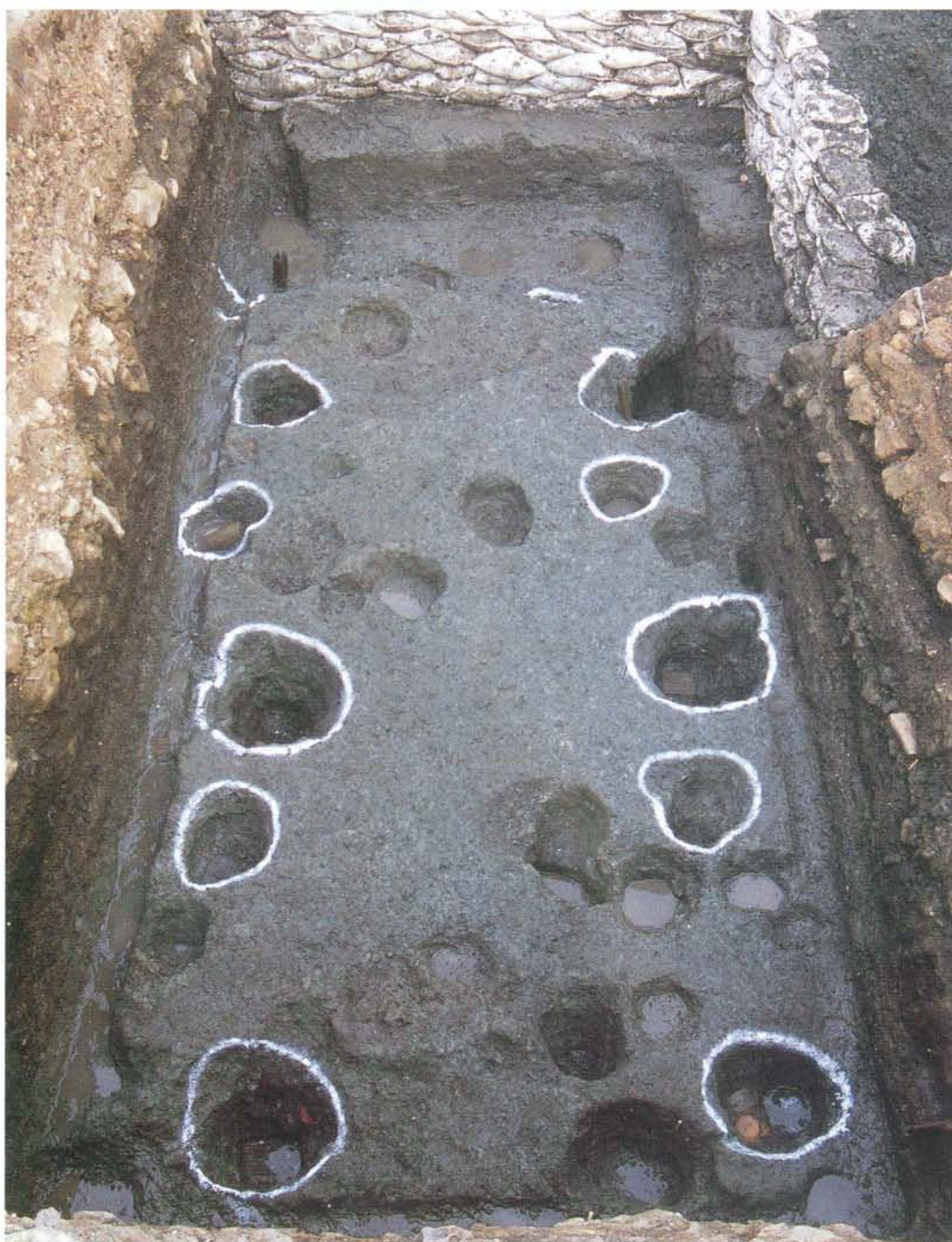
掘立柱建物跡(北側調査区第7面)

調査の結果、中世の生活の跡が11面存在し、上の方の生活面からはかわらけを焼いた跡や、国産や中国産の焼き物のほか いたじめぞめ 板締染と呼ばれる染色用の型板などの出土品があり、最下面では建物跡数棟のほか、瓦を大量に捨てたとみられる瓦溜りなどが発見されました。