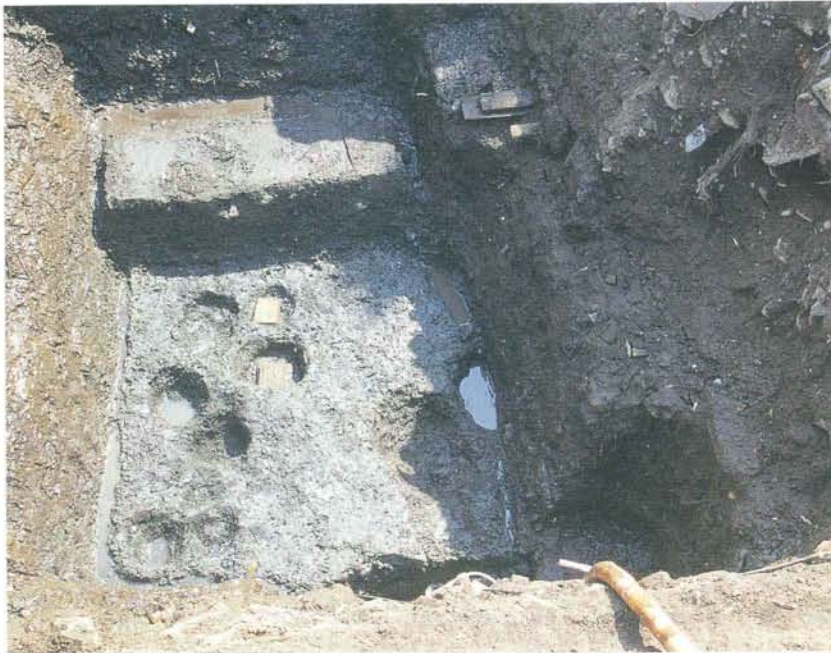
南側調査区の遺構 (第8面)