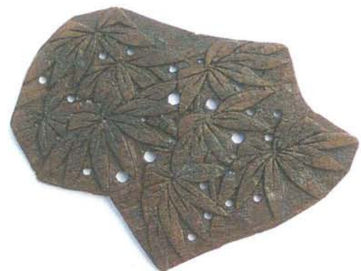
板締染用の型板 (大倉幕府跡出土)

The site of Ōkura Bakufu is the area between Tsurugaoka Hachimangu Shrine and Egara Tenjin Shrine with Seisen primary school in its center. It is reported that Yoritomo Minamoto created his residential building in December 1180 and continued till 1225 when he moved to east side of Wakamiya Ōji. The excavation area of this time situated between Yokohama National University Primary School and Seisen primary school. The result is there are eleven medieval residential areas; we found the site of baking unglazed earthenware in the upper residential area and findings of Japanese and Chinese pottery or Itajimezome which is a pattern board for dyeing. Also we found several building sites and Kawaradamari, a mount of wasted roofing tiles.