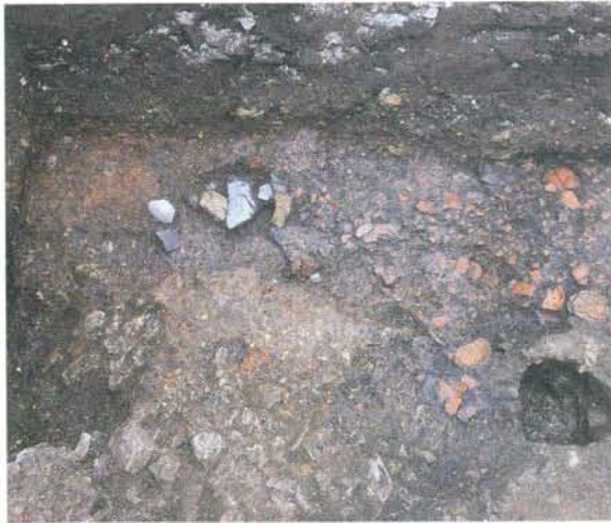
かわらけ焼成遺構 (北側調査区第1面)

最も古い12世紀後半と推定される生活面は現在の地表から約3m下のところにあり、幕府の位置や範囲は定かではありませんが、今よりも3mくらい深い所に建っていたと思われます。また、多くの生活面があることから、幕府が若宮大路沿いに移った後も、当地では連綿として土地利用が続けられていたことがうかがえます。