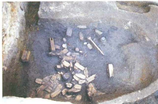
草履 そうり を大量に捨てた穴