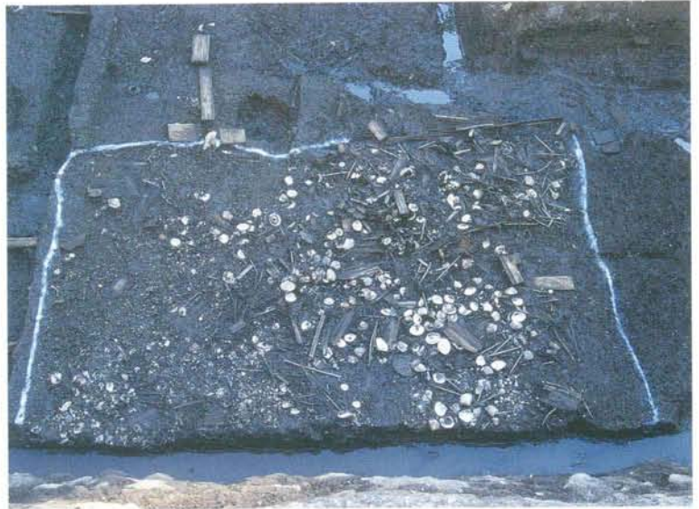
食器や貝などが大量に捨てられた竪穴建築址 (北側調査区第5面)