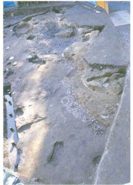
池と遣り水跡(北側調査区)