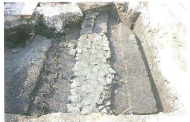
東西方向に伸びる道路