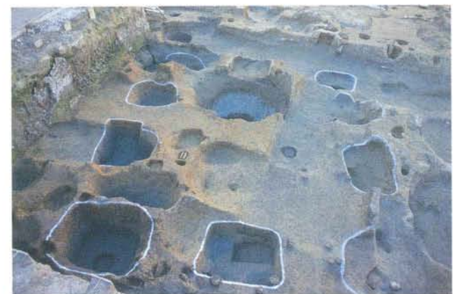
古代の掘立柱建物跡