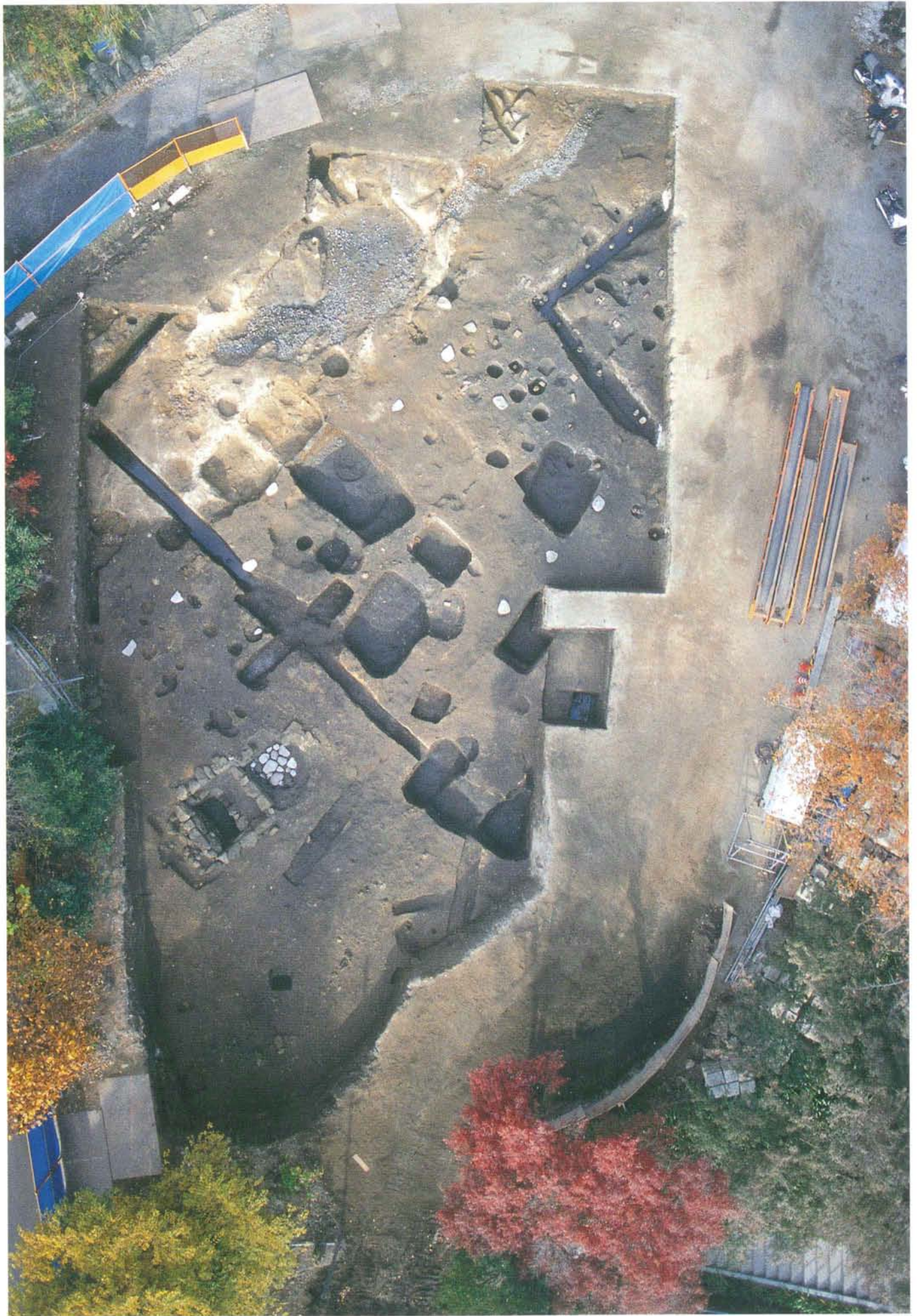
無量寺跡発掘調査区全景(北側)