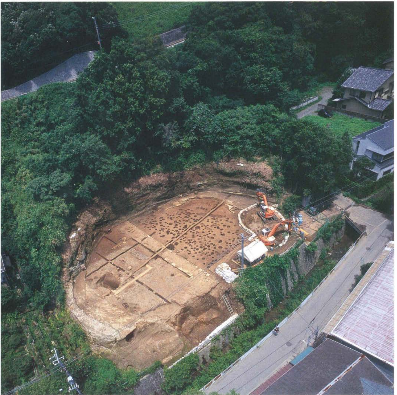
朝比奈砦遺跡発掘調査区遠望