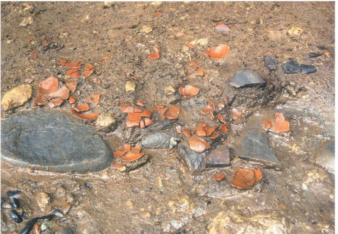
かわらけ出土状態（北西角） Kawarake earthenware unearthed (northwest corner)