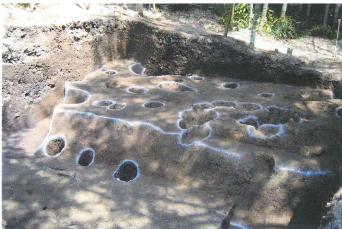
北条高時邸跡発掘 調査区全景 View of Hojo Takatoki's residence site