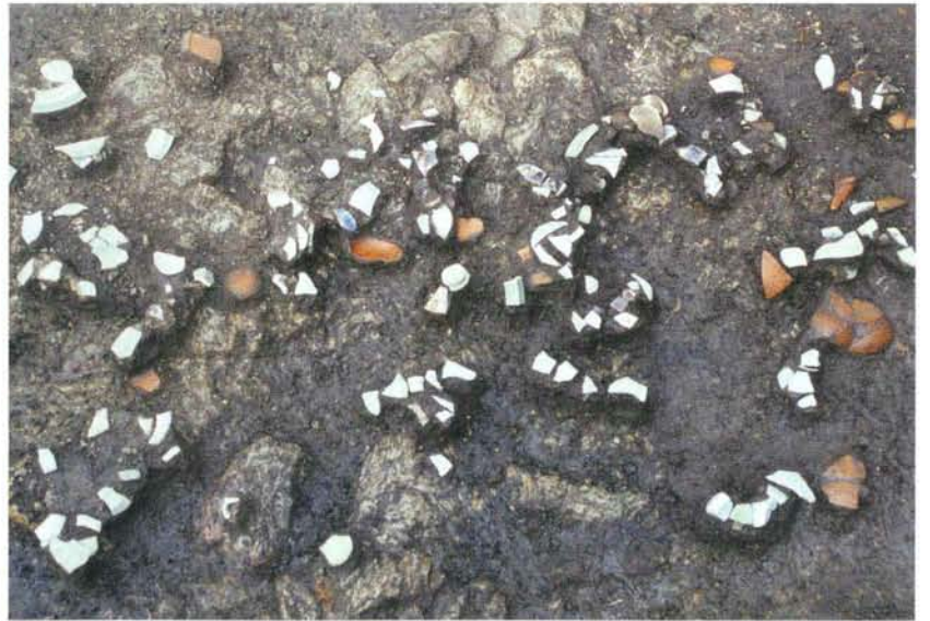
磁器等出土状態 (第2面)

View of the artifacts in situ (pond: 3 rd layer)