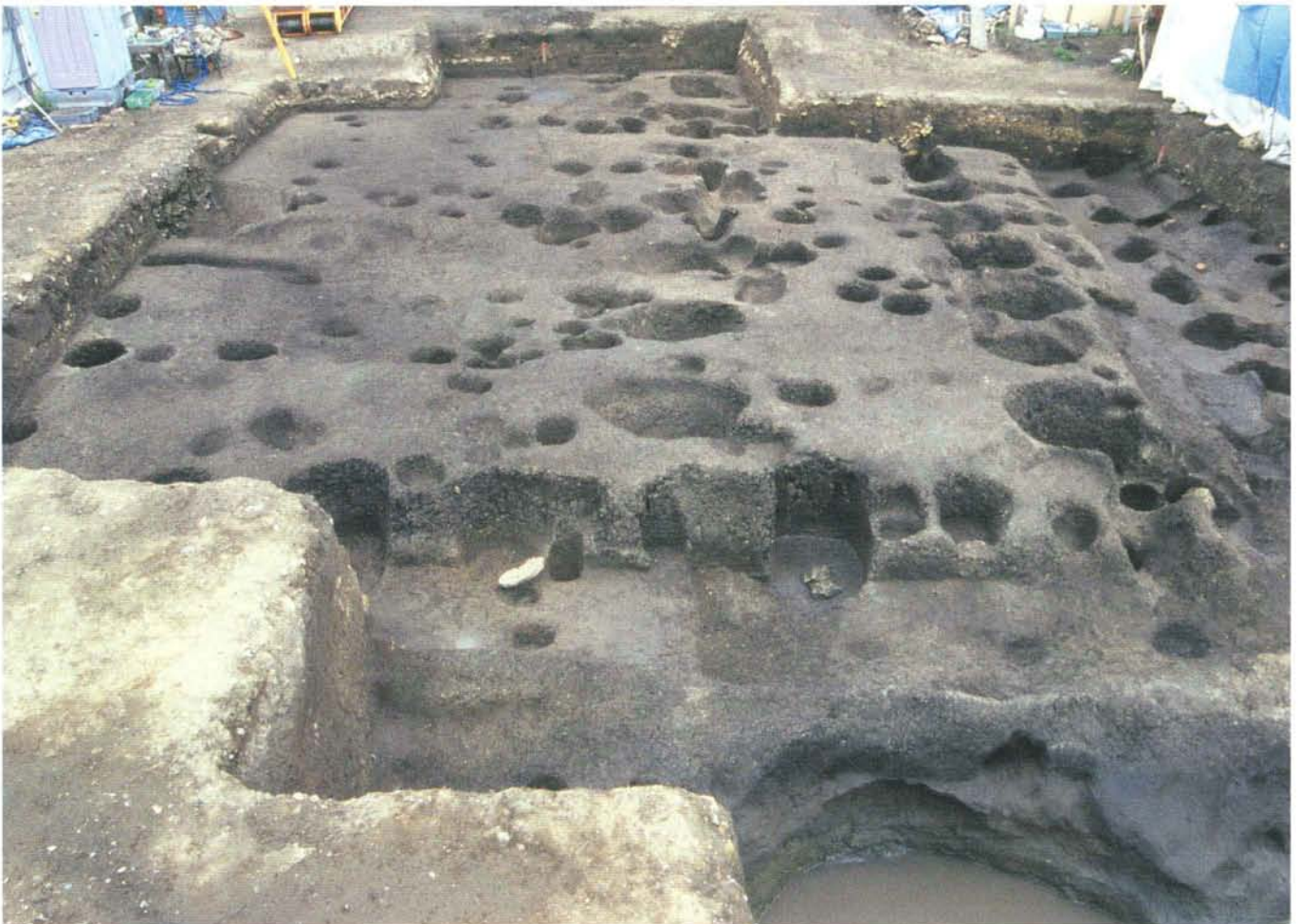
若宮大路周辺遺跡群発掘調査区全景 View of sites surrounding Wakamiya-Oji