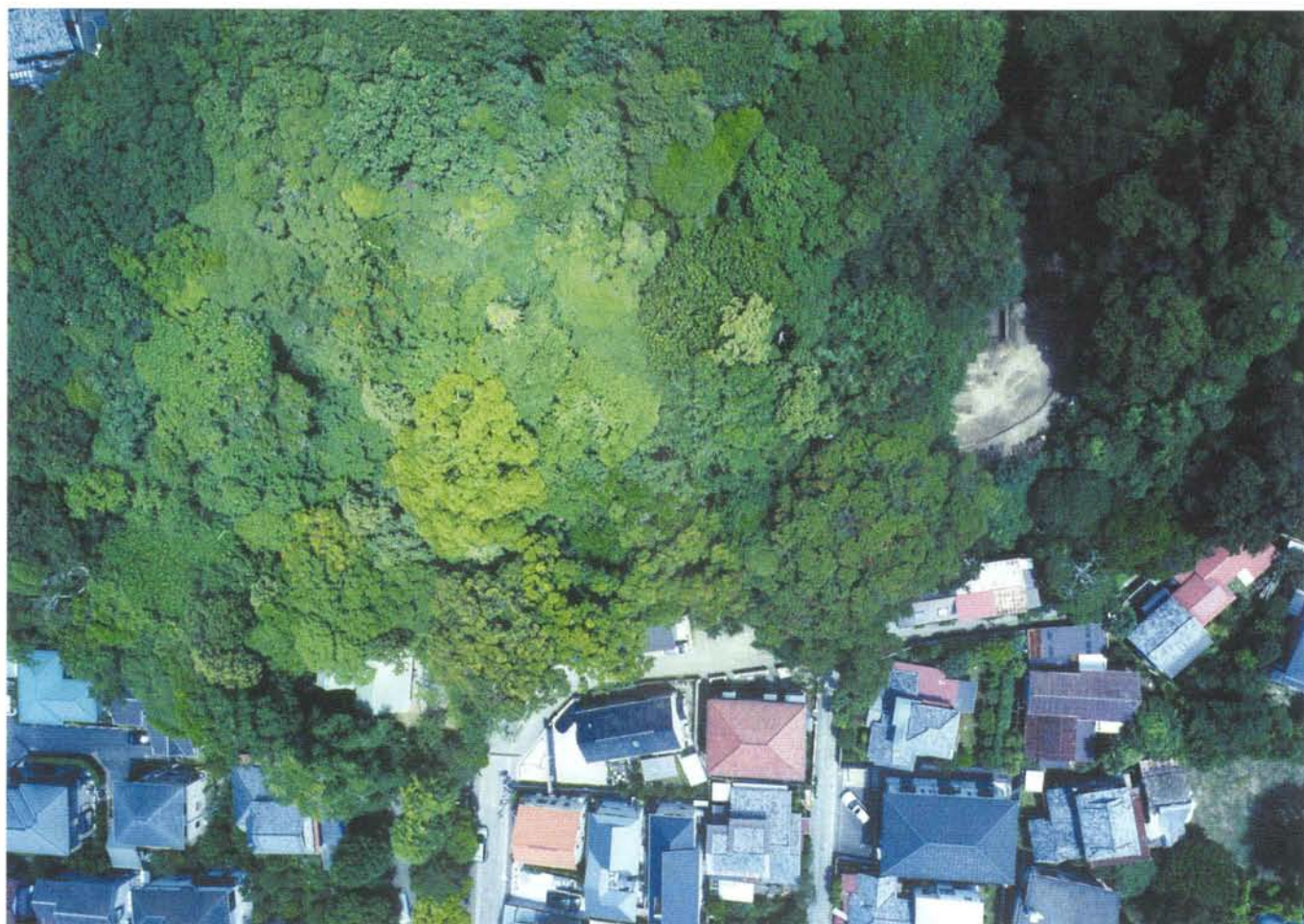
北条義時法華堂跡遠望（写真中央右） Aerial view of Hojo Yoshitoki's Hokedo