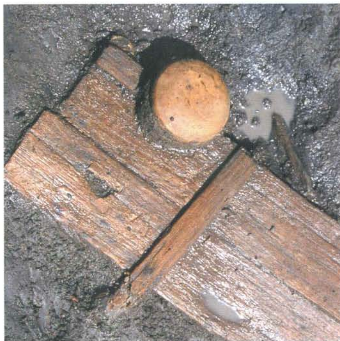
溝の護岸材及びかわらけ出土状態 (第2面) Wooden packing materials for the ditch and kawarake earthenware in situ (2 nd layer)