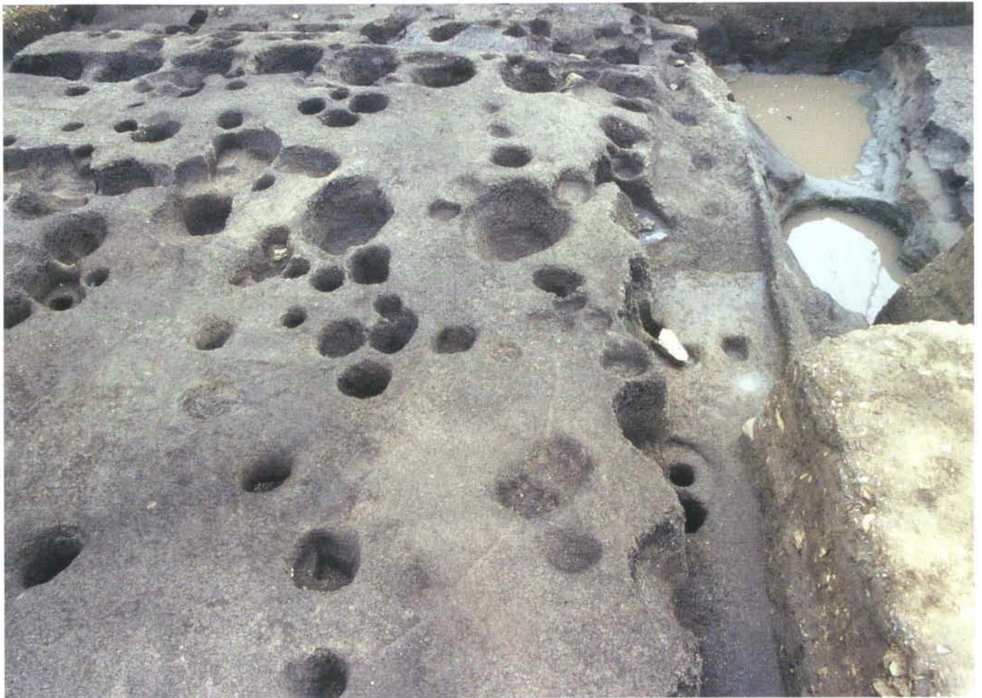
溝と柱穴等 (第3面) Ditches and postholes (3 rd layer)