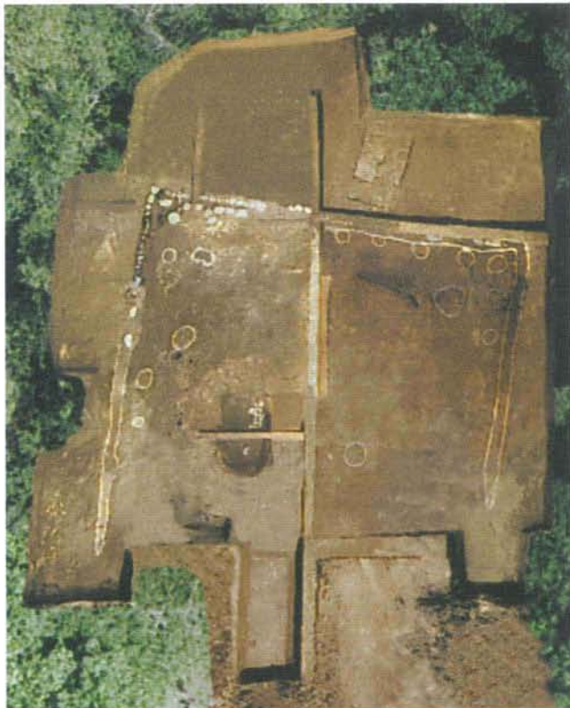
北条義時法華堂跡発掘調査区全景 Aerial view of Hojo Yoshitoki's Hokedo site excavated