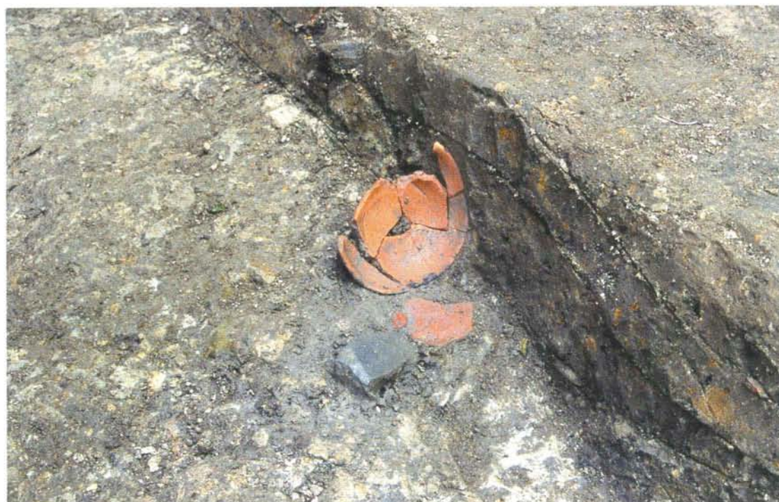
かわらけ出土状態 （西側） Kawarake earthenware unearthed

※『北条九代記』等には「法花堂」としか記されず、弘安三年大火後の義時法華堂の再建については不明です。しかし、建物内外からの出土遺物には15世紀頃の資料があり、何らかの形で義時法華堂が持続した可能性も考えられます。