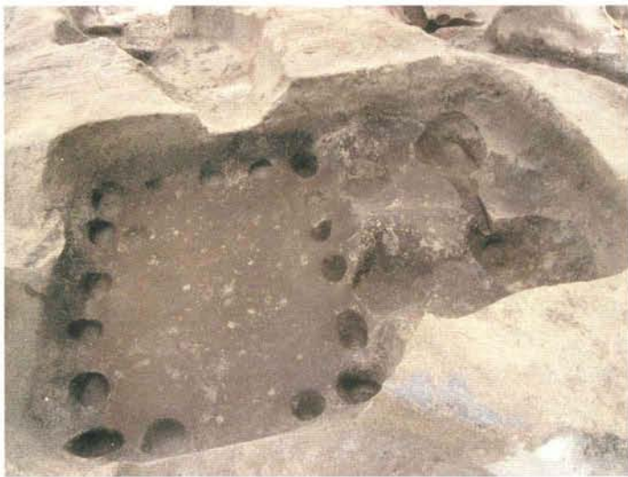
方形竪穴建築址（第1面）