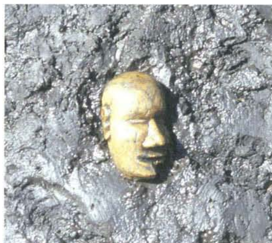
傀儡人形出土状態（今小路西遺跡 池・第3面）

The 1 st stratigraphic layer that dates back to the late 12 th century to early 13 th century was separated by several ditches. The 2 nd stratigraphic layer that dates back to the early 13 th century to early 14 th century uncovered various remains of buildings and postholes of sunken-featured square pit dwellings. The artifacts recovered include animal remains, amongst these a complete dog skeleton. Bones of horses and cows were found but not in a complete state, some showing the signs of manufacture and typical cut marks caused when slaughtering animals. Furthermore, there were dice, hair comb sticks called “kougai”, ornaments made of bones, and metal artifacts including nails, knives and tuyères (bellow nozzle). These evidences indicate the possible medieval industrial location in Kamakura.