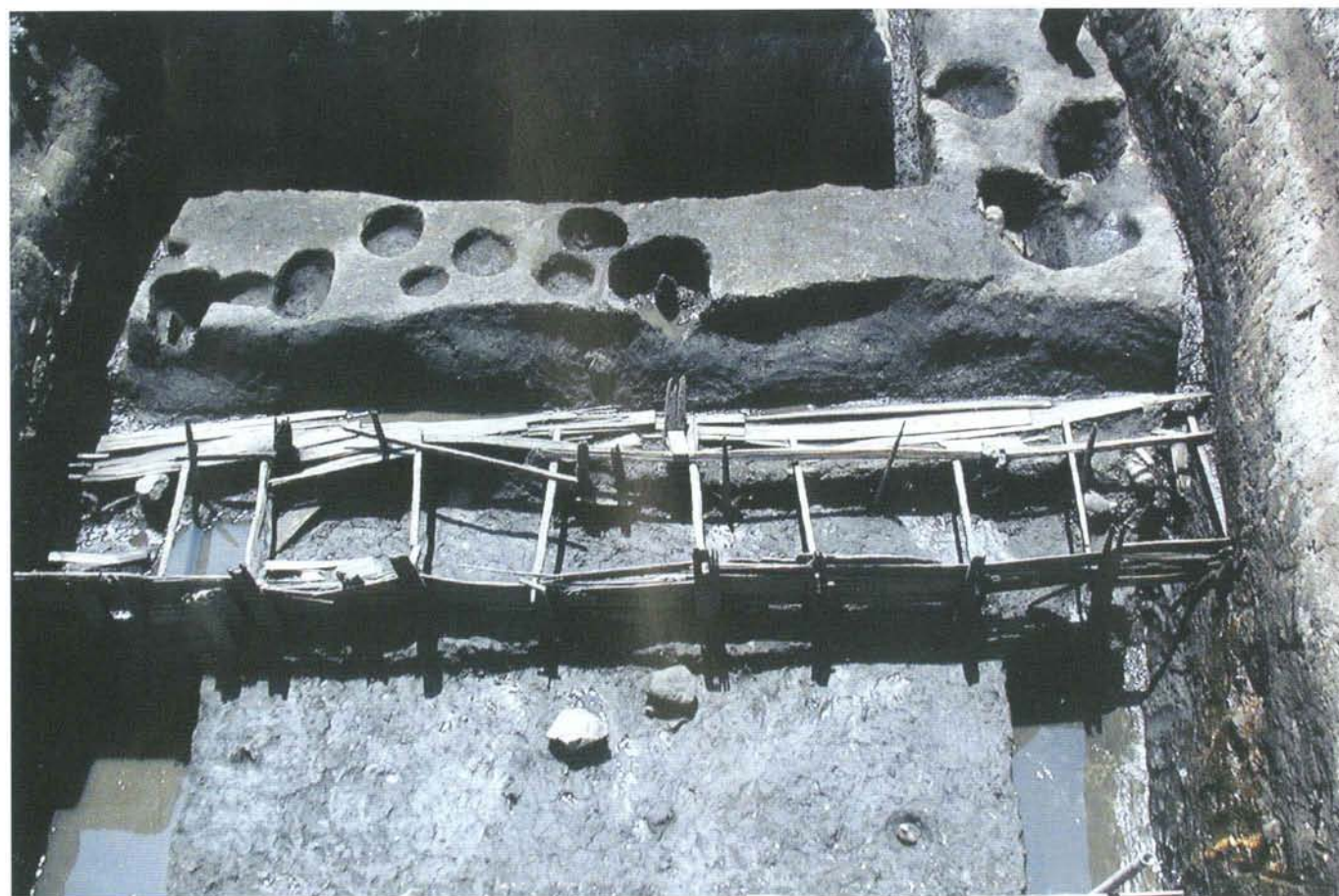
今小路西遺跡発掘調査区全景（池と護岸・第3面）

このように今回の調査成果は、この場所が古代から中世にかけて栄えたことを知ることができる点で、貴重な資料といえましょう。