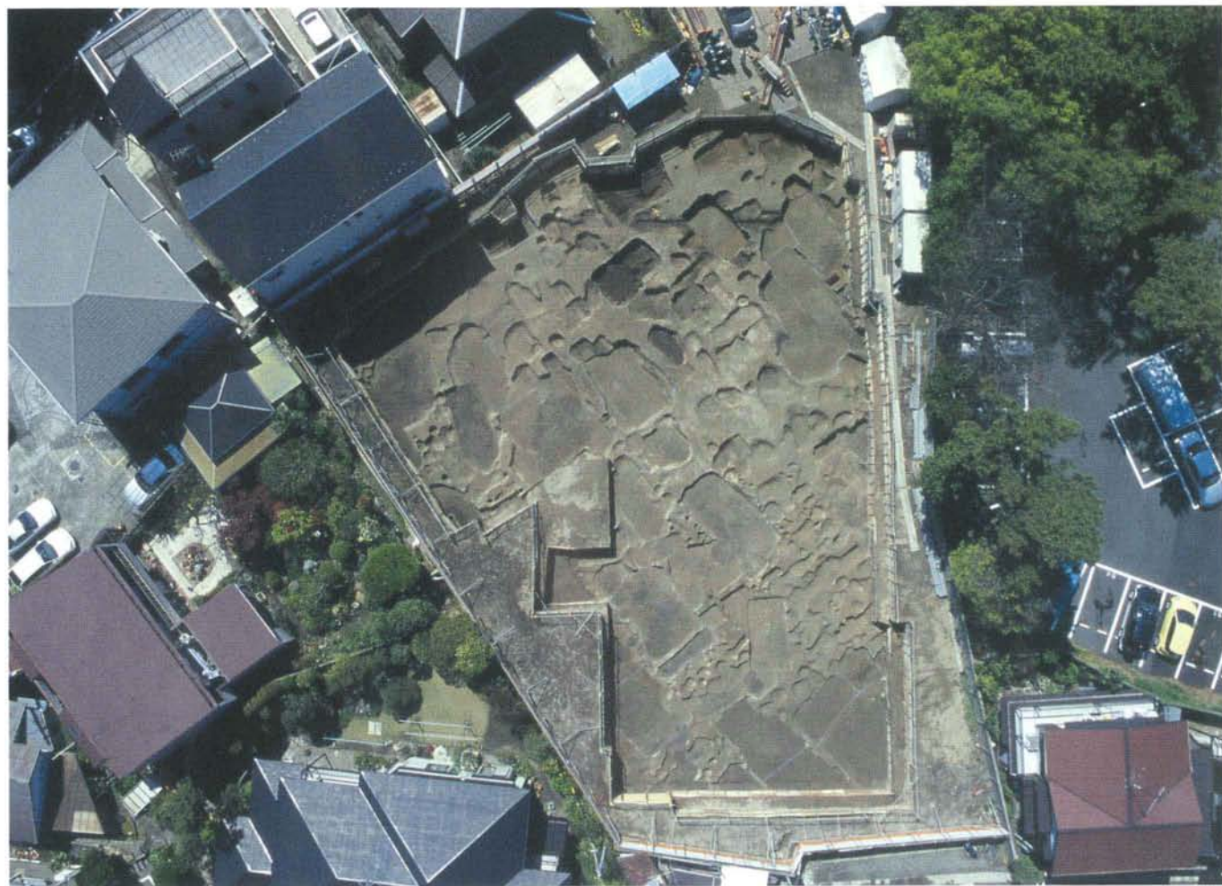
長谷小路周辺遺跡発掘調査区全景 Aerial view of sites surrounding Hase-Koji