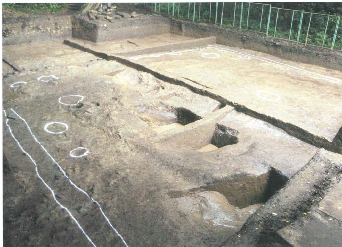
発掘調査区近景 View of the excavated site