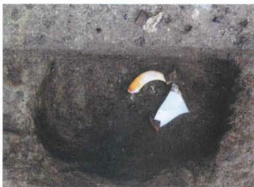
青磁等出土状態 (P.15) Chinese celadon in situ (p15)

今回の調査では、大きな溝のほか、建物の存在を確認しました。溝については、その規模が大きいことから敷地を画するためのものと考えられ、北条高時の屋敷の範囲を考える上で貴重な発見といえましょう。