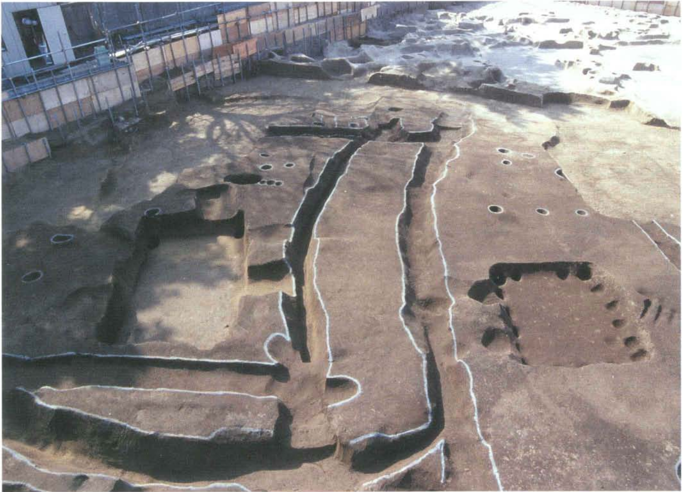
溝と方形竪穴建築址（第2面）