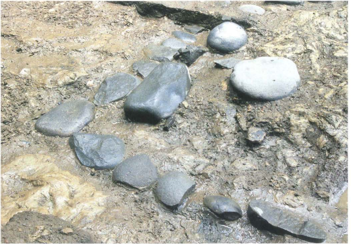
雨落ち溝（北西角） Rain gutter ditches (north-west corner)