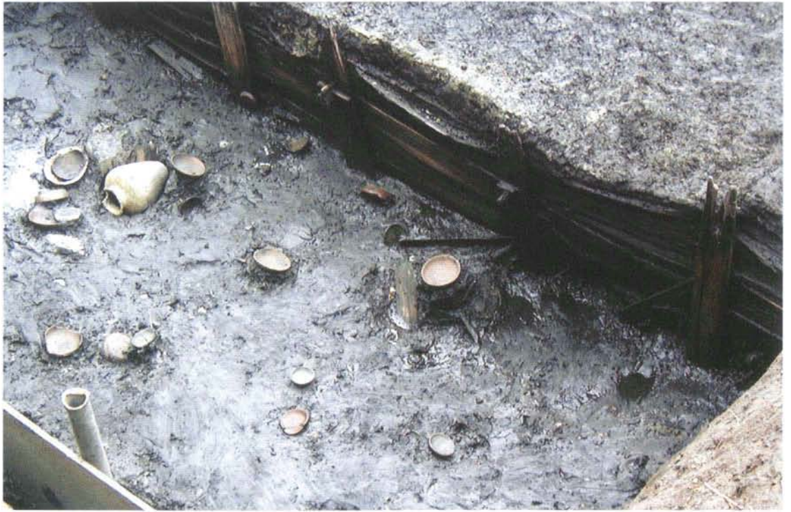
遺物出土状態 (池・第3面)

View of the artifacts in situ (pond: 3 rd layer)