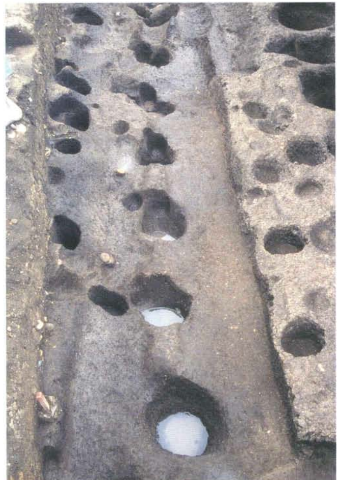
柱穴 (第2面) Postholes (2 nd layer)